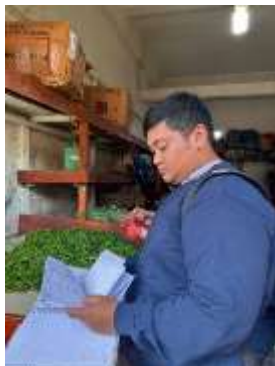
Gambar 3. Observasi Toko Egi Veggie