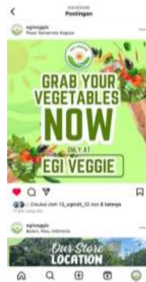
Gambar 16. Tampilan iklan yang sudah di-posting di Instagram