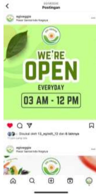
Gambar 25. Postingan Konten Iklan Pada Akun Instagram Setelah Implementasi