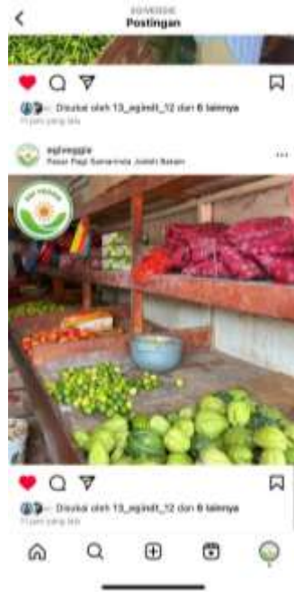
Gambar 23. Postingan Konten Iklan Pada Akun Instagram Setelah Implementasi