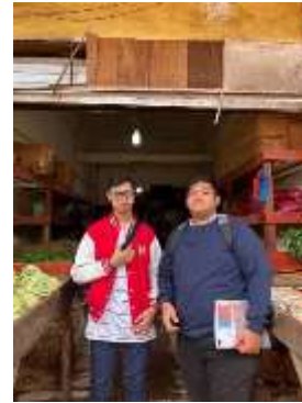
Gambar 5. Observasi Toko Egi Veggie

Toko sayuran Egi Veggie sendiri memiliki titik letak lokasi yang sangat strategis dan juga memiliki segmen pasar yang meyakinkan. Namun, hal itu tidak menjamin stabilitas penjualan toko. Menurut laporan keuangan toko, telah terjadi penurunan yang cukup signifikan selama 6 bulan terakhir dari sebelumnya yang cukup stabil. Pada masa sebelumnya, toko dapat meraup omzet yang lebih besar daripada masa-masa sulit seperti sekarang. Berdasarkan laporan keuangan dalam 3 bulan terakhir, omzet penjualan sudah mulai merangkak naik walaupun tidak begitu signifikan. Belajar dari permasalahan tersebut diatas, maka toko harus memaksimalkan potensi penjualan melalui media yang lebih baik kedepannya. Penjualan melalui media sosial bisa membuat perubahan yang sangat baik dan juga membuat strategi pemasaran yang baik.