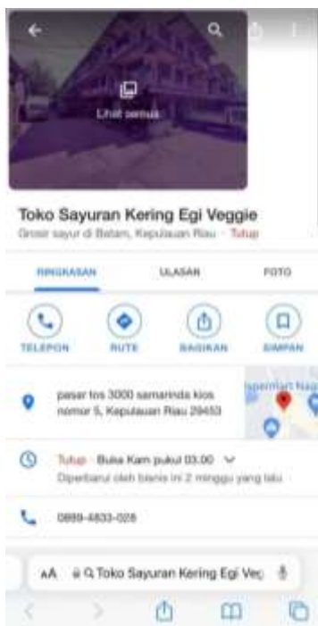
Gambar 11. Tampilan Google Maps Toko Sayuran Kering Egi Veggie

Selanjutnya dilakukan pembuatan atau penandaan lokasi toko pada Google Maps. Penandaan dapat memudahkan akses bagi pelanggan yang ingin mengunjungi lokasi toko. Penandaan lokasi toko pada Google Maps dapat diakses melalui tautan: https://g.co/kgs/Fuw9z2 .