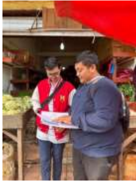
Gambar 2. Observasi Toko Egi Veggie

kelemahan pada toko. Didapati permasalahan-permasalahan dari toko seperti terdapat penjualan yang kadang menurun dan kadang juga stabil, walaupun toko mempunyai pelanggan yang sudah cukup banyak dari berbagai kalangan.