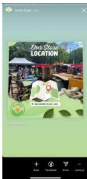
Gambar 14. Tampilan Iklan yang Sudah di-posting di Instagram