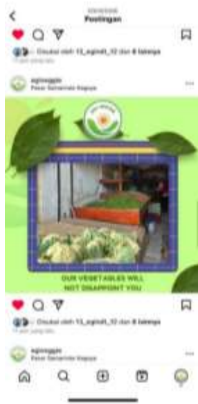
Gambar 13. Tampilan Iklan yang Sudah di-posting di Instagram