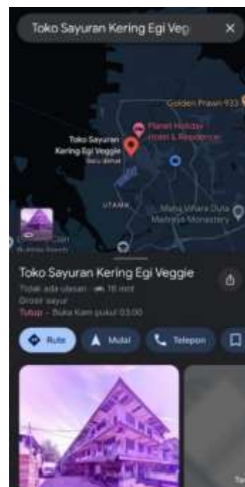
Gambar 12. Tampilan Google Maps Toko Sayuran Kering Egi Veggie

promosi pada akun media sosial Instagram. Konten promosi berupa Feeds Instagram dan juga berupa Story Instagram. Postingan konten dilakukan secara berkala dengan materi konten yang berbagai macam seperti yang telah didesain pada masa awal implementasi kegiatan. Konten yang di- posting pada Feeds Instagram dan juga Story Instagram dapat dijangkau dan dilihat oleh siapa saja pengguna Instagram diseluruh daerah.