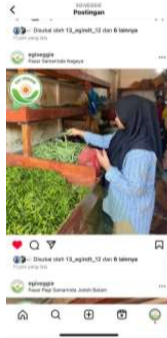
Gambar 22. Postingan Konten Iklan Pada Akun Instagram Setelah Implementasi