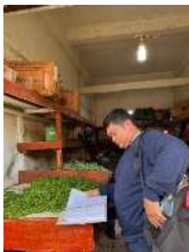
Gambar 4. Observasi Toko Egi Veggie