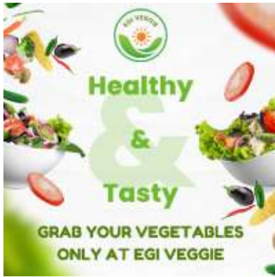
Gambar 10. Desain Iklan atau Promosi

Selanjutnya dilakukan pembuatan atau penandaan lokasi toko pada Google Maps. Penandaan dapat memudahkan akses bagi pelanggan yang ingin mengunjungi lokasi toko. Penandaan lokasi toko pada Google Maps dapat diakses melalui tautan: https://g.co/kgs/Fuw9z2 .