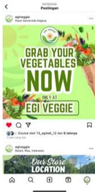
Gambar 24. Postinga Konten Iklan Pada Akun Instagram Setelah Implementasi

Setelah proses implementasi dilakukan, terdapat beberapa poin pencapaian yang dirasakan Toko Sayuran Kering Egi Veggie. Terdapat juga beberapa poin yang dapat menjadi evaluasi yang dapat menjadi perubahan kedepannya seperti berikut: