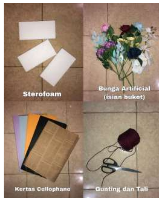
Gambar 2. Alat dan Bahan untuk Membuat Buket

Kegiatan diawali dengan menyampaikan penyuluhan kepada peserta pelatihan mengenai urgensi kegiatan, kreativitas, serta peluang usaha. Selanjutnya peserta pelatihan dikenalkan dengan jenis produk, serta alat dan bahan yang digunakan untuk membuat produk. Alat dan bahan dijelaskan pada gambar 2.