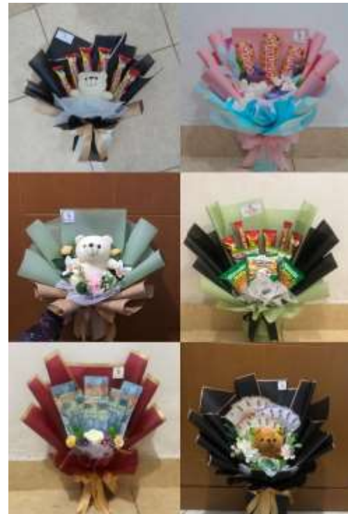
Gambar 3. Hasil Karya Peserta Pelatihan Pembuatan Buket

Periksa kembali buket untuk memastikan semua elemen terpasang dengan baik. Sesuaikan jika diperlukan agar buket terlihat rapi dan menarik.