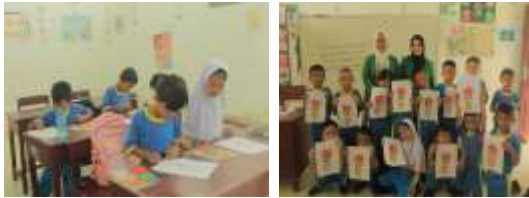
Gambar 4. Kegiatan Pembuatan Kolase dari Biji-bijian

dari bahan bekas maupun bahan alami, dapat meningkatkan kreativitas anak. 2) Mengombinasikan berbagai bentuk untuk membuat pola gambar memungkinkan anak mewarnai gambar tersebut sesuai dengan warna bahan yang digunakan.