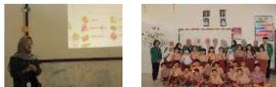
Gambar 2. Kegiatan Edukasi Penyuluhan Vitamin C

Kegiatan edukasi dilaksanakan di SDN 101812 Namo Tualang dengan sasaran kegiatan adalah Siswa Kelas 5.