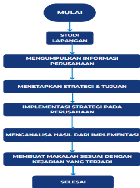
Gambar 1. Diagram Metode Penelitian