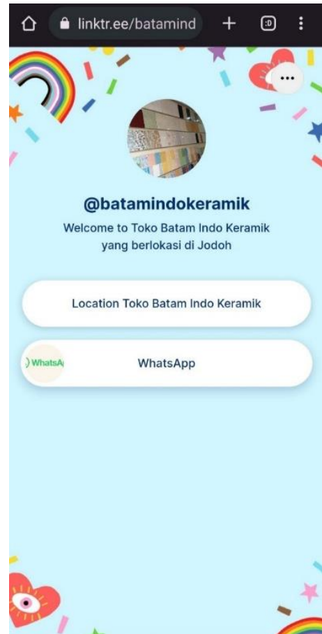
Gambar 3. Tampilan Linktree

Media website yang dibuatkan oleh peneliti kepada Batam Indo Keramik adalah Linktree yang berisi data link menuju ke nomor WhatsApp dan link menuju lokasi usaha berupa Google Maps . Berikut link website yang telah dibuat linktr.ee/batamindokeramik dan dibawah ini berupa tampilan Linktree yang telah dibuat oleh peneliti.