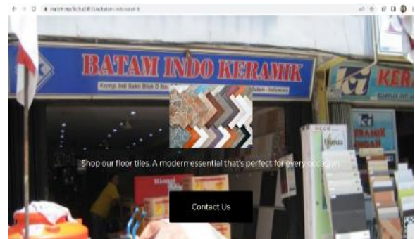
Gambar 5. Tampilan Web Mailchimp

ke WhatsApp dan lokasi perusahaan berada.