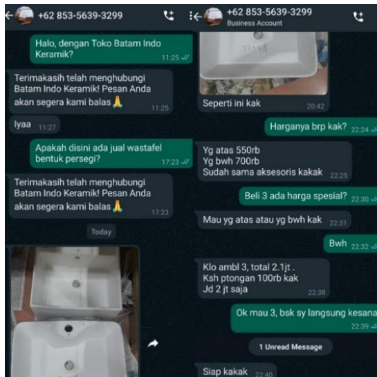
Gambar 4. Tampilan Pesan WhatsApp dengan Customer