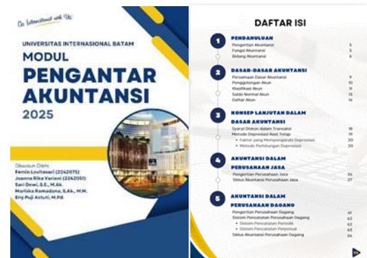
Gambar 4. Cover dan Daftar Isi Modul Pembelajaran

terlampir cover dan daftar isi dari modul sebagai bukti perancangan kegiatan: