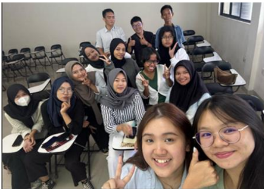
Gambar 3. Dokumentasi Bersama Siswa-siswi SMAN 26 Batam

Selanjutnya, terdapat luaran utama dari kegiatan PkM ini yakni penyusunan modul pembelajaran tambahan untuk mata pelajaran Pengantar Akuntansi. Modul ini disusun sebagai salah satu bentuk kontribusi nyata dalam membantu siswa-siswi untuk meningkatkan kemampuan akademik di lingkungan sekolah, khususnya dalam memperkuat pemahaman mengenai konsep dasar akuntansi yang menjadi landasan sebelum memasuki perkuliahan maupun dunia kerja di bidang akuntansi dan keuangan. Berikut