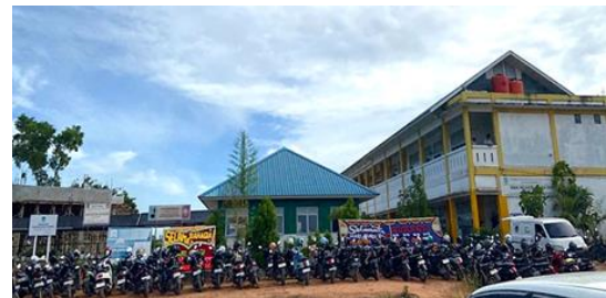
Gambar 1. SMA Negeri 26 Batam

berupaya menghadirkan proses pembelajaran yang efektif melalui berbagai kegiatan akademik dan non-akademik, sehingga siswa-siswi memiliki ruang untuk mengembangkan potensi mereka. Dengan komitmen terhadap kualitas pendidikan dan lingkungan belajar yang positif, SMAN 26 Batam menjadi mitra yang mendukung pelaksanaan kegiatan Pengabdian kepada Masyarakat (PkM).