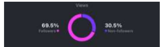
Gambar 10. Insight Video Pertama

Pada video kedua, hasil yang ditunjukkan adalah sebesar 57.4% pengikut Instagram Tore telah menonton video Profil Tore tersebut dan sebanyak 42.6% penonton adalah bukan merupakan pengikut Instagram Tore. Hal ini menunjukkan bahwa video Profil Tore tersebut telah berhasil menarik perhatian pelanggan mengenai profil atau informasi mengenai Tore secara lebih luas, dan tidak hanya menjangkau pengikut Instagram Tore saja.