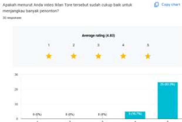
Gambar 17. Hasil Kuesioner Video Iklan Tore

Hasil kuesioner pada video Proses Pembuatan Menu menunjukkan sejumlah 86.7% atau sebanyak 26 responden berpendapat bahwa video tersebut bermanfaat untuk ditonton pelanggan, dan merasa tertarik untuk mencoba menu yang ada pada video Proses Pembuatan Menu tersebut. Hal ini menunjukkan bahwa video Proses Pembuatan Menu yang dibuat berpengaruh terhadap upaya menunjukkan kualitas menu dari Tore Japanese Restaurant.