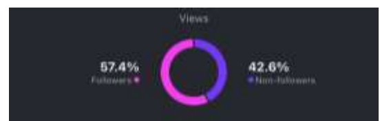
Gambar 11. Insight Video Kedua

Pada video kedua, hasil yang ditunjukkan adalah sebesar 57.4% pengikut Instagram Tore telah menonton video Profil Tore tersebut dan sebanyak 42.6% penonton adalah bukan merupakan pengikut Instagram Tore. Hal ini menunjukkan bahwa video Profil Tore tersebut telah berhasil menarik perhatian pelanggan mengenai profil atau informasi mengenai Tore secara lebih luas, dan tidak hanya menjangkau pengikut Instagram Tore saja.