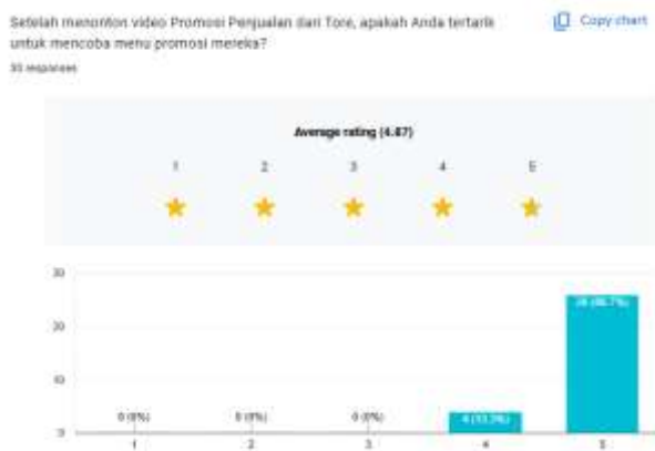
Gambar 15. Hasil Kuesioner Video Promosi Penjualan

Hasil kuesioner pada video Profil Tore menunjukkan sejumlah 66.7% atau sebanyak 20 responden merasa bahwa Video Profil Tore membantu mereka