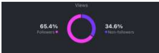
Gambar 12. Insight Video Ketiga

Pada video keempat, hasil yang ditunjukkan adalah sebesar 69.8% pengikut Instagram Tore telah menonton video Proses Pembuatan Menu Tore tersebut dan sebanyak 30.2% penonton adalah bukan merupakan pengikut Instagram Tore. Hal ini menunjukkan bahwa video Proses Pembuatan Menu Tore tersebut telah berhasil menarik perhatian pelanggan dalam mengetahui proses pembuatan menu di Tore secara lebih luas, dan tidak hanya menjangkau pengikut Instagram Tore saja.