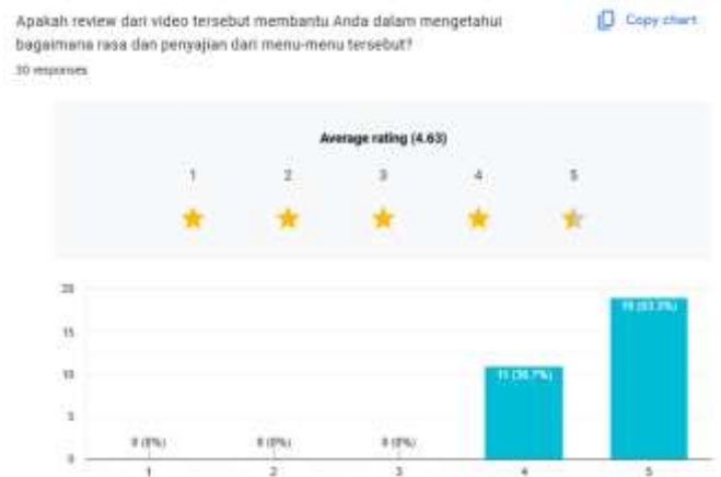
Gambar 19. Hasil Kuesioner Video Review Pelanggan Tore

Hasil kuesioner pada video Review Pelanggan menunjukkan sejumlah 63.3% atau sebanyak 19 responden merasa terbantu dalam mengetahui rasa dan penyajian dari menu-menu yang ada pada Tore Japanese Restaurant, berpendapat bahwa video Review Pelanggan tersebut telah tersampaikan dengan baik ke penonton, dan responden ingin mencoba menu-menu yang direview di video Review Pelanggan tersebut. Hal ini menunjukkan bahwa video Review Pelanggan yang dibuat berpengaruh terhadap upaya menginfokan rasa dari menu-menu yang ada pada Tore Japanese Restaurant.