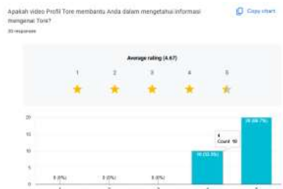
Gambar 16. Hasil Kuesioner Video Profil Tore

Hasil kuesioner pada Video Iklan Tore menunjukkan sejumlah 83.3% atau sebanyak 25 responden berpendapat bahwa Video Iklan tersebut sudah cukup baik untuk menjangkau banyak penonton, mendapat gambaran mengenai Tore Japanese Restaurant setelah menonton Video Iklan tersebut, dan responden berpendapat bahwa akan ada lebih banyak orang yang tertarik untuk mengunjungi Tore secara langsung melalui Video Iklan tersebut yang muncul di Instagram mereka. Hal ini