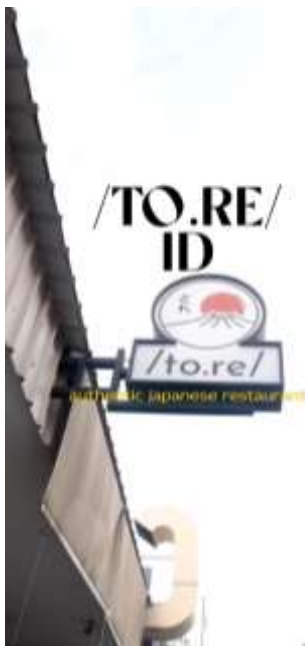
Gambar 4. Iklan Instagram

Adapun informasi yang diberikan kepada pelanggan melalui video iklan ini adalah cuplikan beberapa momen yang ada selama Tore beroperasi dan bagaimana suasana yang bisa dinikmati oleh pelanggan ketika mengunjungi Tore. Berikut merupakan video iklan yang dibuat oleh penulis: