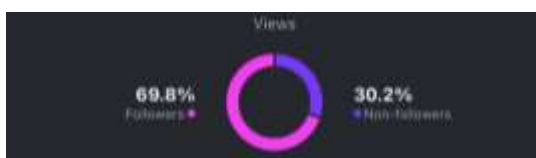
Gambar 13. Insight Video Keempat

Pada video kelima, hasil yang ditunjukkan adalah sebesar 66% pengikut Instagram Tore telah menonton video Review Pelanggan tersebut dan sebanyak 34% penonton adalah bukan merupakan pengikut Instagram Tore. Hal ini menunjukkan bahwa video Review Pelanggan tersebut telah berhasil menarik perhatian pelanggan dalam mengetahui ulasan yang diberikan kepada menu-menu yang ada di Tore secara lebih luas, dan tidak hanya menjangkau pengikut Instagram Tore saja.