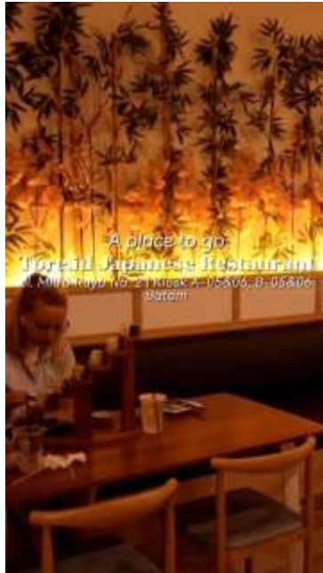
Gambar 5. Profil Tore Japanese Restaurant

untuk ditonton, dan dapat membuat penonton ingin mencoba langsung menu-menu yang ada di Tore Japanese Restaurant. Berikut merupakan video Proses Pembuatan Menu yang dibuat oleh penulis: