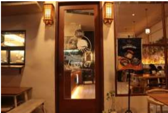
Gambar 1. Tore Japanese Restaurant

Restaurant Tore merupakan restaurant yang menjual berbagai menu makanan dan minuman khas Jepang yang telah berdiri di Batam sejak bulan Februari tahun 2021. Restaurant Tore berlokasi di Jl. Mitra Raya 2 (Mitra 2) Kiosk A-05&06 B-05&06, Batam. Restaurant Tore memiliki konsep modern yang menjual hidangan khas Jepang yang semua menunya 100% halal dan jadwal operasionalnya adalah hari Senin-Minggu, pukul 10.00 hingga 22.00.