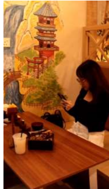
Gambar 7. Review Pelanggan

Penulis melakukan implementasi selama 2 hari dan 1 hari untuk melakukan wawancara dengan manajer restaurant. Proses implementasi memerlukan waktu selama kurang lebih 2 jam untuk melakukan pembuatan kelima video tersebut. Berikut merupakan foto dokumentasi saat penulis melakukan implementasi dan foto bersama dengan manajer Tore: