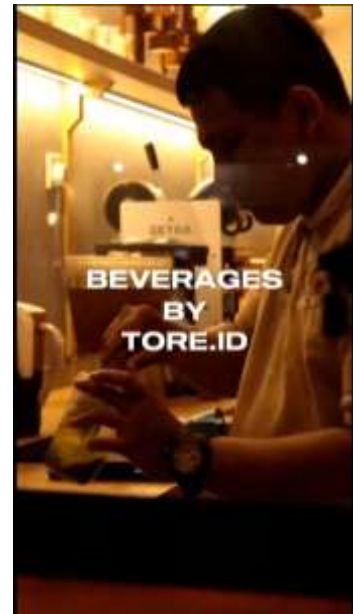
Gambar 6. Proses Pembuatan Menu

untuk ditonton, dan dapat membuat penonton ingin mencoba langsung menu-menu yang ada di Tore Japanese Restaurant. Berikut merupakan video Proses Pembuatan Menu yang dibuat oleh penulis: