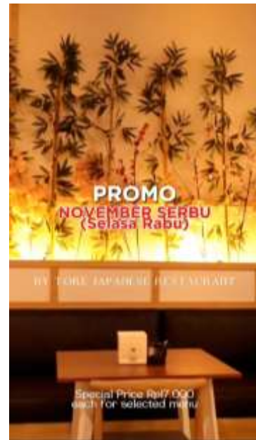
Gambar 3. Promosi Penjualan

Promo yang sedang dijalankan tersebut adalah promo khusus yang hanya berlaku di bulan November, dimana pelanggan bisa mendapatkan harga spesial yaitu hanya Rp17.000 untuk setiap menu tertentu yang telah ditetapkan oleh Tore. Beberapa menu tersebut adalah Miso Spicy Ramen, Salmon Baked Gunkan, dan Tamago Mentai. Untuk mendapatkan diskon pada beberapa menu tersebut, pelanggan dapat mengunjungi Tore Japanese Restaurant dan promo khusus ini memiliki syarat dan ketentuan yang berlaku. Berikut merupakan video Promosi Penjualan yang dibuat oleh penulis: