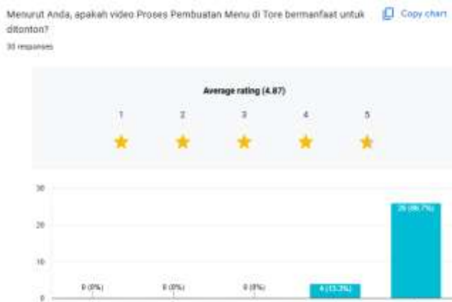
Gambar 18. Hasil Kuesioner Video Proses Pembuatan Menu

Hasil kuesioner pada video Review Pelanggan menunjukkan sejumlah 63.3% atau sebanyak 19 responden merasa terbantu dalam mengetahui rasa dan penyajian dari menu-menu yang ada pada Tore Japanese Restaurant, berpendapat bahwa video Review Pelanggan tersebut telah tersampaikan dengan baik ke penonton, dan responden ingin mencoba menu-menu yang direview di video Review Pelanggan tersebut. Hal ini menunjukkan bahwa video Review Pelanggan yang dibuat berpengaruh terhadap upaya menginfokan rasa dari menu-menu yang ada pada Tore Japanese Restaurant.