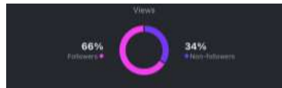
Gambar 14. Insight Video Kelima

Selain melakukan postingan video-video tersebut, penulis juga membuat kuesioner dalam bentuk Google Form kepada beberapa pelanggan, baik itu pelanggan yang telah mengetahui Tore maupun pelanggan yang belum pernah mengunjungi Tore untuk menonton video-video promosi tersebut. Penulis membuat kuesioner yang berisikan pendapat dari penonton setelah menonton kelima video tersebut dalam bentuk skala atau rating , serta menanyakan pendapat mereka mengenai seberapa besar pengaruh dari kelima video tersebut terhadap peningkatan penjualan di Tore, dan manfaat