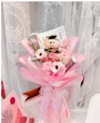
Gambar 1. Hasil Foto Produk yang diedit