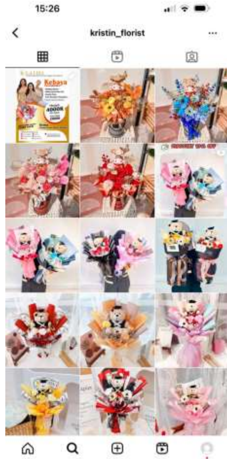
Gambar 3. Susunan Foto di Instagram

Setelah penulis melaksanakan kegiatan penerapan bauran pemasaran kepada UMKM Kristin Florist, terdapat perkembangan berupa followers Instagram menjadi 11.600 pengikut dan pengunjung situs profile Instagram juga bertambah. Selain itu, likers pada foto produk bertambah dan juga ada yang menyimpan foto produknya. Berikut adalah kondisi setelah implementasi kami.