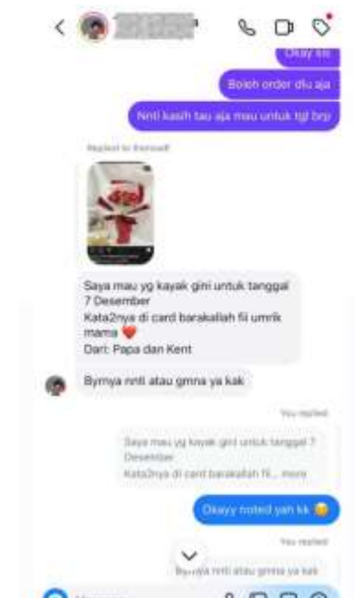
Gambar 5. Hasil Review dari Pelanggan UMKM Kristin Florist