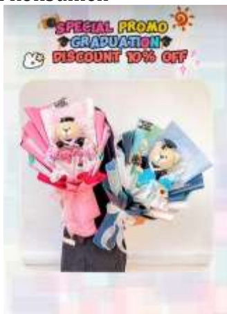
Gambar 2. Promo Produk