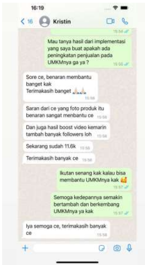
Gambar 6. Hasil Ulasan Pemilik UMKM Kristin Florist