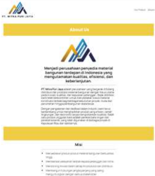
Gambar 4.5 Halaman About