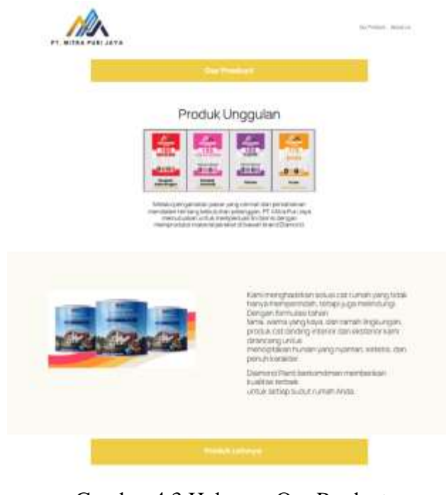
Gambar 4.3 Halaman Our Product