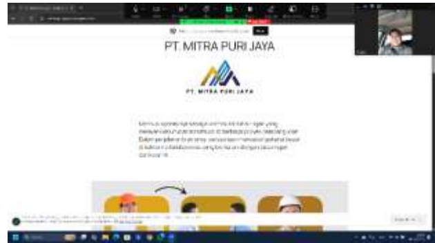
Gambar 5.1 Dokumentasi Uji Coba Website

Calon pelanggan dapat melihat katalog produk lengkap tanpa harus menghubungi pihak perusahaan secara langsung. Perusahaan memiliki kontrol mandiri terhadap pembaruan konten melalui dashboard WordPress yang mudah digunakan. Evaluasi akhir menunjukkan bahwa sistem telah berjalan dengan baik, tampilan website responsif di berbagai perangkat, serta fitur-fitur yang disediakan berfungsi sesuai dengan kebutuhan perusahaan. Dengan adanya website ini, PT. Mitra Puri Jaya dinilai lebih siap menghadapi persaingan di era digital dan memiliki fondasi kuat untuk pengembangan strategi pemasaran online ke depannya.