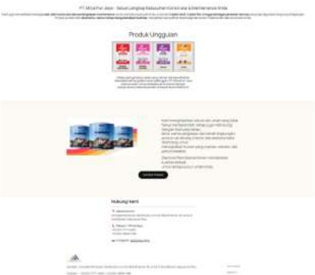
Gambar 4.2 Halaman Home 2