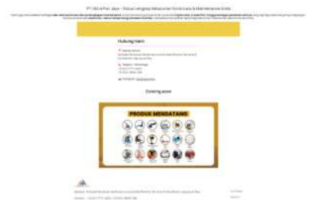
Gambar 4.4 Halaman Our Product 2