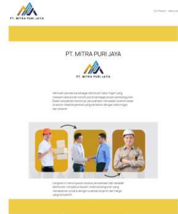
Gambar 4.1 Halaman Home