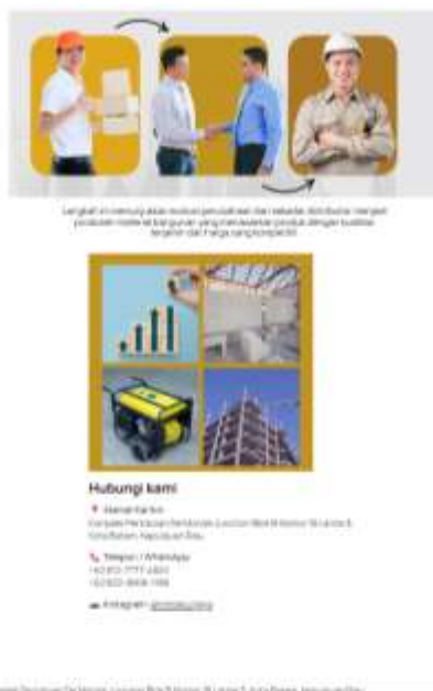
Gambar 4.6 Halaman About 2