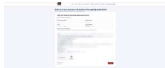
Gambar 3.2 Form Registrasi Relawan

Fitur pendaftaran relawan disediakan melalui formulir input data seperti nama lengkap, informasi kontak, dan area minat relawan. Halaman formulir registrasi ini dapat dilihat pada Gambar 3.2 .