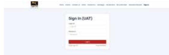
Gambar 3.1 Tampilan Menu Utama Sistem Volunteer Donation Management

Antarmuka utama sistem menampilkan menu navigasi yang tersusun rapi untuk memudahkan pengguna dalam mengakses berbagai modul. Tampilan menu utama sistem ditunjukkan pada Gambar 3.1 .