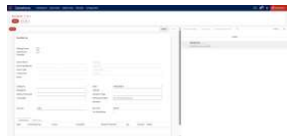
Gambar 3.7 Form Pembuatan Data Donasi

Untuk memasukkan data donasi baru, admin dapat mengakses formulir khusus yang mencatat jenis sumbangan, nilai donasi, metode pembayaran, dan waktu transaksi. Tampilan formulir tersebut ditunjukkan pada Gambar 3.7 .