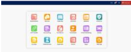
Gambar 3.3 Tampilan Halaman Utama Sistem Volunteer Donation Management

Salah satu fitur penting adalah dashboard untuk manajemen relawan. Melalui tampilan ini, admin dapat melihat daftar kehadiran, penugasan aktivitas, dan rekap kontribusi individu. Ilustrasi tampilan dashboard relawan ditampilkan pada Gambar 3.4 .