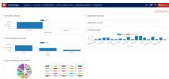
Gambar 3.4 Dashboard Modul Volunteer

Salah satu fitur penting adalah dashboard untuk manajemen relawan. Melalui tampilan ini, admin dapat melihat daftar kehadiran, penugasan aktivitas, dan rekap kontribusi individu. Ilustrasi tampilan dashboard relawan ditampilkan pada Gambar 3.4 .