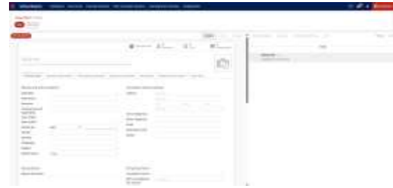
Gambar 3.5 Form Pembuatan Data Volunteer

Formulir pendataan relawan dilengkapi dengan fitur validasi input untuk memastikan kelengkapan dan akurasi data yang dikumpulkan. Tampilan dari formulir pembuatan data relawan ditampilkan pada Gambar 3.5 .