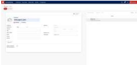
Gambar 3.8 Form Pembuatan Data Donor

Selain itu, terdapat fitur manajemen data donatur yang memungkinkan pembaruan data personal. Formulir data donatur dapat dilihat pada Gambar 3.8 .