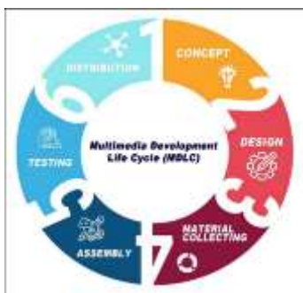
Gambar 1. Multimedia Development Life Cycle (MDLC)