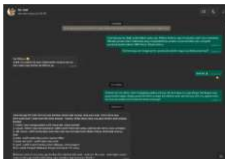
Gambar 2. Diskusi dengan Pihak Sekolah terkait Konsep Foto

Pada tahap awal pelaksanaan, penulis melaksanakan diskusi dengan pihak sekolah guna mengidentifikasi dan merumuskan tema yang akan digunakan oleh masing-masing kelas dalam proyek fotografi ini (lihat gambar 2). Setiap kelas diberikan keleluasaan untuk memilih konsep tema yang unik serta merepresentasikan karakteristik siswa di dalamnya. Beberapa tema yang dipilih antara lain Old Money , Black and White , Streetwear , Beachwear .