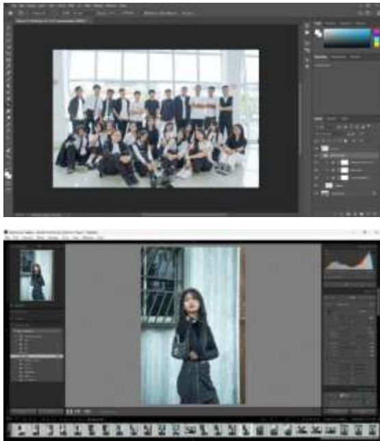
Gambar 4. Proses Editing Foto di Aplikasi Adobe Photoshop dan Adobe Lightroom Classic

layak untuk disajikan kepada pihak sekolah.