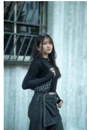
Gambar 5. Contoh hasil akhir Foto Siswa dengan tema Streetwear

Hasil akhir dari proyek fotografi ini berupa kumpulan foto kelas beserta pengelompokkan kecil telah diserahkan sepenuhnya dalam bentuk digital kepada pihak sekolah. Foto-foto tersebut dapat digunakan untuk keperluan yearbook maupun arsip dokumentasi siswa (lihat gambar 5). Pihak sekolah menyatakan kepuasan terhadap hasil kerja penulis, baik dari sisi teknis fotografi maupun ketepatan waktu penyelesaian. Dengan adanya dokumentasi ini, sekolah merasa terbantu dalam menyiapkan kenang-kenangan visual yang berkualitas bagi siswa (lihat gambar 6).