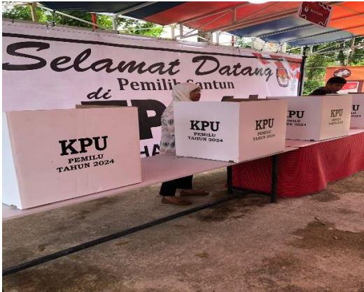
Gambar 2. Foto Dokumentasi TPS