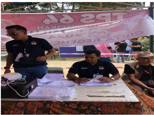
Gambar 3. Foto Dokumentasi TPS