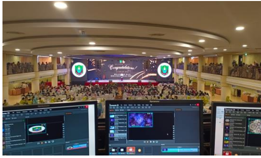
Gambar 4, Menjadi operator videotron / led pas acara wedding , wisuda, dll

Kegiatan magang keempat adalah menjadi operator videotron atau layar LED dalam acara seperti wedding, wisuda, atau event besar lainnya adalah tanggung jawab yang melibatkan keterampilan teknis dan manajemen visual.