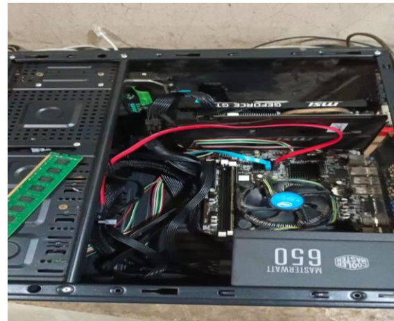
Gambar 3, Memperbaiki salah satu komputer back office

Kegiatan kedua selama magang adalah memasang videotron atau layar LED di sebuah grand ballroom seperti di Pacific melibatkan serangkaian langkah yang cukup kompleks untuk memastikan instalasi yang aman dan hasil tampilan visual yang optimal. Videotron atau LED display adalah layar besar yang terdiri dari panel-panel LED yang dapat menampilkan gambar, video, dan informasi visual secara dinamis.