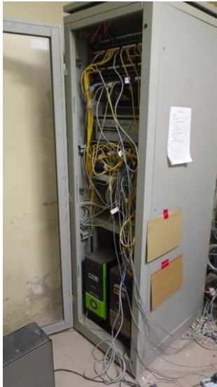
Gambar 1, Merapikan kabel jaringan server

Kegiatan pertama dalam magang adalah merapikan kabel jaringan server, kegiatan ini menjadi langkah penting untuk memastikan infrastruktur jaringan yang terorganisir, efisien, dan mudah dikelola. Kabel yang berantakan dapat menyebabkan kesulitan dalam pemeliharaan, troubleshooting, dan bahkan dapat mengganggu performa jaringan