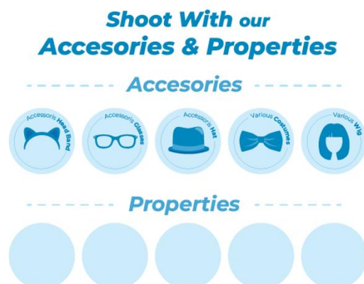
Gambar 2. Desain bagian properties