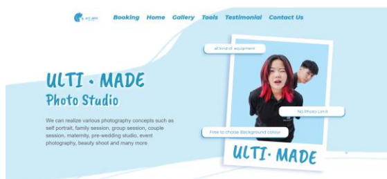
Gambar 4. Hasil deploy

Desain yang sudah disetujui akan diimplementasikan kepada website menggunakan Laravel 8. Pada proses pembuatan website ini, penulis langsung mendeploy hasil pembuatan website ke domain yang sudah disiapkan oleh orang yang bertanggung jawab pada Ultimade Studio. Hasil dari website yang sudah dibuat dapat dibuka di ultimadestudio.com. Selain itu, penulis juga membantu dalam proses pencarian aset yang cocok untuk website.