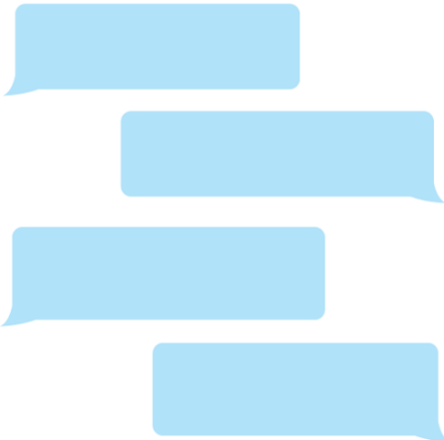
Gambar 3. Desain reviews

Desain yang sudah disetujui akan diimplementasikan kepada website menggunakan Laravel 8. Pada proses pembuatan website ini, penulis langsung mendeploy hasil pembuatan website ke domain yang sudah disiapkan oleh orang yang bertanggung jawab pada Ultimade Studio. Hasil dari website yang sudah dibuat dapat dibuka di ultimadestudio.com. Selain itu, penulis juga membantu dalam proses pencarian aset yang cocok untuk website.