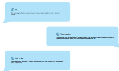
Gambar 8. Kolom review pelanggan