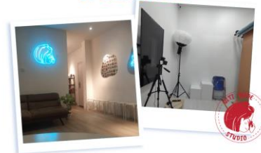
Gambar 9. Take a Peek