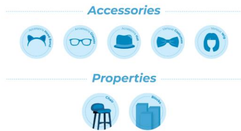
Gambar 7. Aksesoris yang tersedia