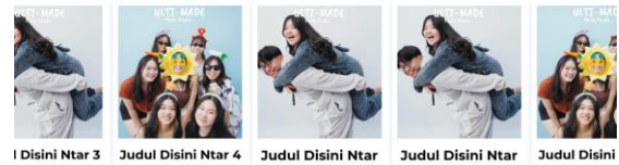
Gambar 6. Portfolio Ultimade Studio