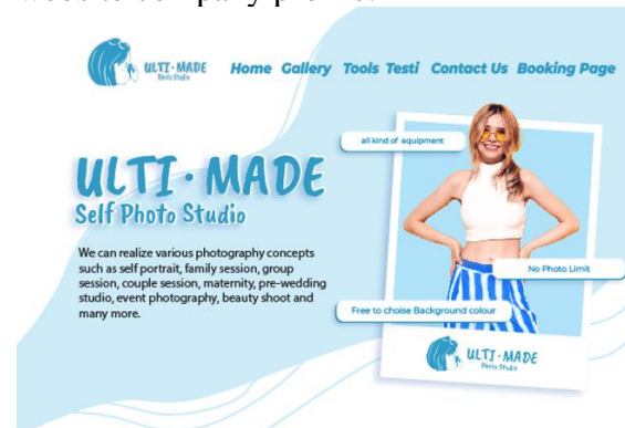
Gambar 1. Desain Landing Page

Desain untuk website company profile Ultimade Studio dibuat menggunakan figma dengan desain One Page Responsive. Desain dilakukan selama seminggu dan dikirim ke orang yang bertanggung jawab di Ultimade Studio untuk di setujui dan di implementasikan ke website company profile.