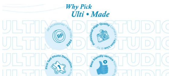
Gambar 5. Why pick us