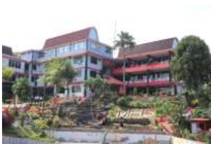
(Gambar 1. Gedung Sekolah)

Tujuan dibuatnya video bermacam-macam, sesuai dengan yang dibutuhkan, contohnya video stopmotion, video animasi, video livestream, video interaktif, dan video promosi seperti yang digunakan sekolah Multistudi High School Batam, di era sekarang banyak sekolah yang menggunakan platform media sosial untuk mengenalkan sekolah melalui internet sehingga mempermudah orang untuk mengetahui informasi dimana saja dan kapan saja.