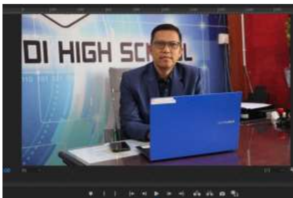
(Gambar 5. Penyelesaian Video)

kemedia sosial dan tidak ada lagi revisi yang dilakukan.