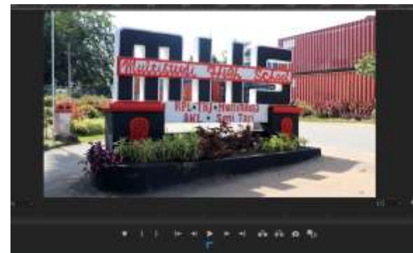
(Gambar 3. Memilih Urutan Video)