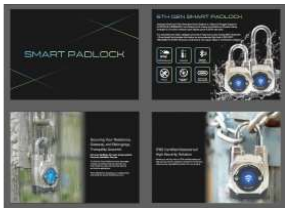
Gambar 2. Hasil Desain Katalog Produk

Desain katalog dan pembuatan video direncanakan membutuhkan 16 putaran (sprint) yang dimulai pada tanggal 1 Desember 2023 dan berakhir pada tanggal 31 Maret 2024. Setiap putaran (sprint) memiliki durasi lima hari kerja, dimulaidari hari Senin hingga Jumat. Setiap putaran dimulai dengan pertemuan perencanaan (sprint planning) pada hari Senin. Berikut adalah tabel yang menampilkan jadwal pelaksanaan putaran (sprint) untuk perancangan desain katalog dan pembuatan video.