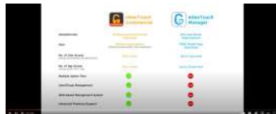
Gambar 3. Hasil Video eGeeTouch

Katalog Produk eGeeTouch ini merupakan project yang direncanakan untuk membuat desain katalog untuk unggah ke website atau diperlihatkan kepada pelanggan. pada project ini penulis bekerja sebagai desainer grafis dalam project ini penulis menggunakan adobe illustrator dan photoshop untuk melakukan semua proses desain.