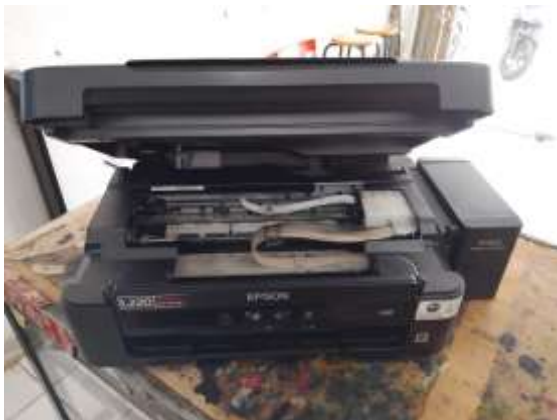
Gambar 1. Dokumentasi Pelaksanaan Magang

Dokumentasi pelaksanaan kegiatan magang yang dilakukan penulis di toko Puricom.