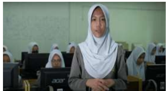
Gambar 12. Pengenalan Diri dari Siswi SMK Al-Azhar Batam

Setelah menampilkan suasana kelas akuntansi, selanjutnya adalah pengenalan diri dan penjelasan tentang apa itu akuntansi dan jenjang karir setelah lulus dari jurusan Akuntansi.