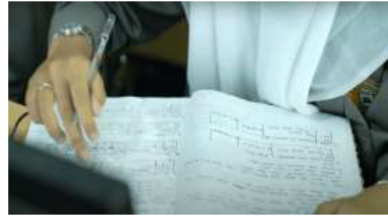
Gambar 11. Penjelasan Jurusan Akuntansi

Setelah menampilkan suasana kelas akuntansi, selanjutnya adalah pengenalan diri dan penjelasan tentang apa itu akuntansi dan jenjang karir setelah lulus dari jurusan Akuntansi.