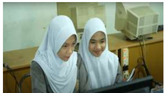
Gambar 13. Pengenalan Diri dari Siswi SMK Al-Azhar Batam