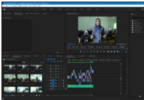
Gambar 4. Proses Edit dengan Menggunakan Aplikasi Adobe Premiere Pro 2020

Kamera yang digunakan pada perancangan ini adalah Sony Alpha 7S III dengan lensa f2.8,24-70mm.