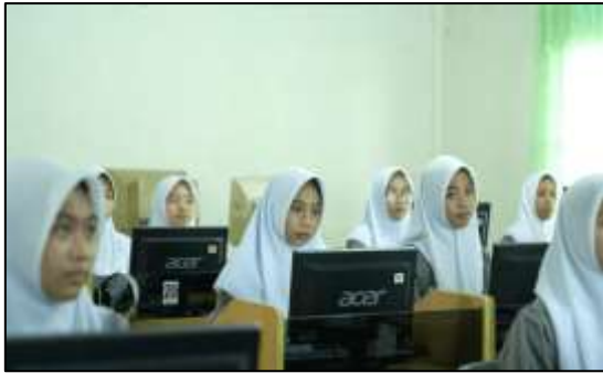
Gambar 7. Suasana Ruangn Kelas Akuntansi