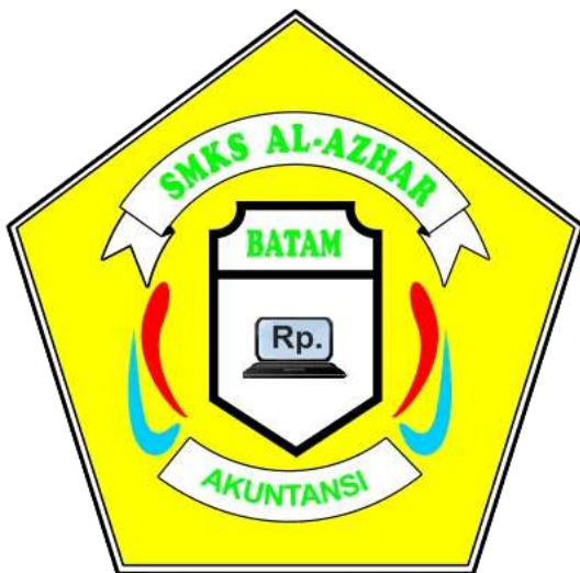
Gambar 16. Logo Akuntansi SMK Al-Azhar Batam

Untuk ending -nya, ditampilkan dengan logo sekolah SMK Al-Azhar Batam dan Yayasan Perguruan Islam Al-Azhar Batam.