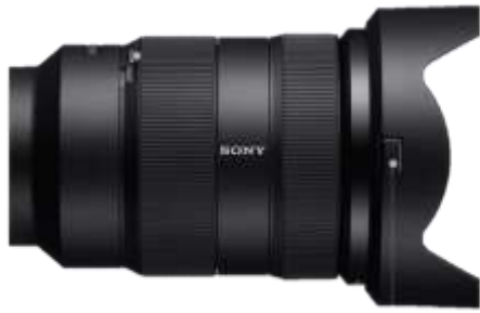
Gambar 3. Lensa Kamera f2.8,24-70mm

Kamera yang digunakan pada perancangan ini adalah Sony Alpha 7S III dengan lensa f2.8,24-70mm.