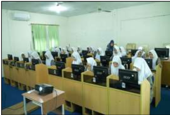
Gambar 8. Suasana Ruangn Kelas Akuntansi

Pada tampilan ini, penulis akan menampilkan suasana kelas akuntansi.