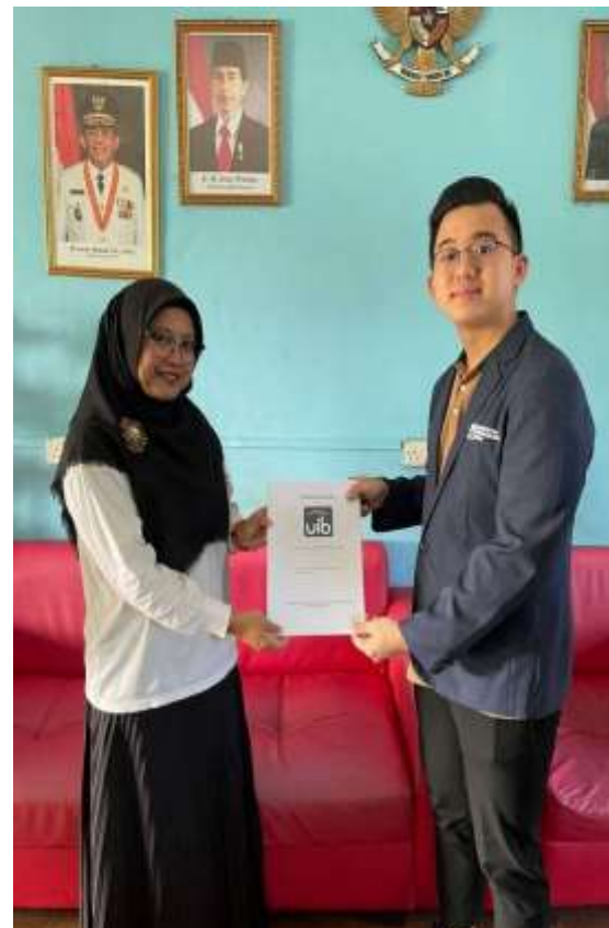
Gambar 17. Dokumentasi dengan Wakil Kepala Sekolah SMK Al-Azhar Batam

Setelah implementasi selesai, penulis melakukan dokumentasi bersama Wakil Kepala Sekolah SMK Al-Azhar Batam. Selain itu, penulis meminta cap sekolah dan tanda tangan kepala sekolah sebagai implementasi telah selesai.