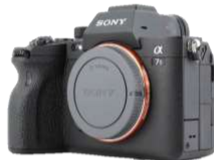
Gambar 2. Kamera Sony A7S III

Dapat kita amati dari rangkaian gambar cerita di atas pada adegan pertama, penulis memulai dengan memperkenalkan video profil SMK Al-Azhar Batam. Dilanjutkan pada adegan kedua, penulis merekam suasana di dalam ruangan kelas. Kemudian, pada adegan ketiga tampak siswa-siswi sedang belajar. Langkah berikutnya, pada adegan keempat kepala jurusan memberikan penjelasan singkat mengenai konsep akuntansi di SMK Al-Azhar Batam. Pada adegan kelima, murid-murid menjelaskan fasilitas dan materi yang mereka dapatkan dalam jurusan Akuntansi di SMK Al-Azhar Batam. Akhirnya, pada adegan keenam video profil ditutup dengan tampilan logo jurusan dan logo sekolah.