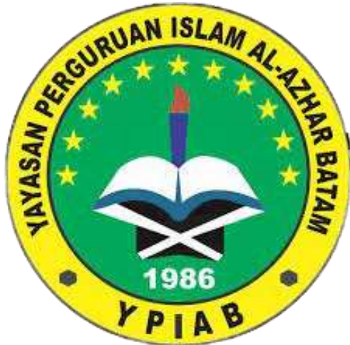
Gambar 15. Logo SMK Al-Azhar Batam

Selanjutnya, penulis menampilkan pengenalan dari siswi SMK Al-Azhar Batam dan mewawancarai tentang alasan memilih jurusan Akuntansi serta memilih SMK Al-Azhar.