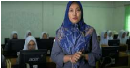
Gambar 9. Pengenalan Diri dari Guru Akuntansi dan Penjelasan Jurusan Akuntansi

Pada tampilan ini, penulis akan menampilkan suasana kelas akuntansi.