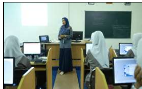
Gambar 6. Suasana Kelas Guru Mengajar

Pada tampilan intro akan menampilkan gedung sekolah.