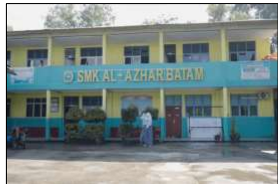
Gambar 5. Gedung SMK Al Azhar Batam

Setelah menyelesaikan tahap pra-produksi, langkah berikutnya adalah memasuki tahap produksi, di mana penulis pergi ke lokasi mitra dan melakukan pengambilan gambar video sesuai dengan konsep yang telah disetujui oleh mitra. Peralatan yang digunakan oleh penulis dalam proses perekaman video adalah kamera Sony Alpha 7S III dengan lensa f2.8 24-70mm, mic shotgun mic rode , dan gimbal ronin rs2 . Pada tahap ini, penulis melakukan proses pengambilan gambar dari berbagai aktivitas di sekolah dan juga fasilitas-fasilitas yang ada dengan melibatkan siswa dan siswi SMK Al-Azhar Batam yang menjelaskan tentang kegiatan dan fasilitas tersebut.