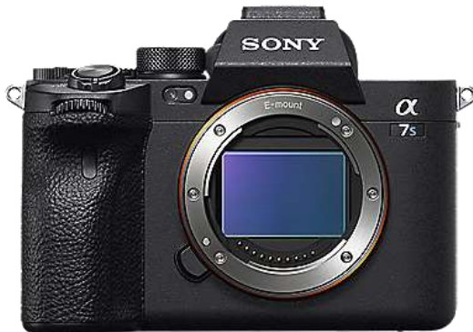
Kamera yang digunakan pada perancangan ini adalah Sony Alpha 7S III dengan lensa f2.8,24-70mm.

RPL di SMK Al-Azhar Batam, dan scene 6 menutupi video profil dengan menggunakan logo jurusan dan logo sekolah.