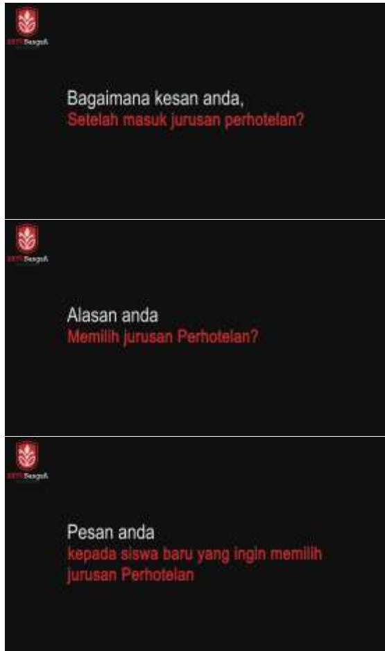
Gambar 10. Empat Pertanyaan yang Diajukan Penulis