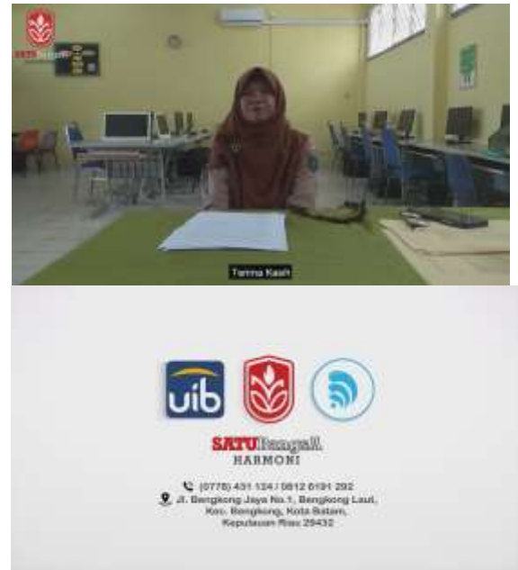
Gamabr 12. Penutup Akhir Video

Setelah bagian penjelasan, penulis kemudian memperlihatkan bagian penulis menanyakan empat pertanyaan dan dijawab oleh dua murid SMK Satu Bangsa Harmoni Batam.