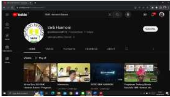
Gamabr 14. Tempat Dimana Video Profil Rancangan Penulis Diupload Oleh Mitra

Dengan mengoptimalkan efisiensi operasional dan memberikan data yang akurat untuk pengambilan keputusan, sistem informasi dapat menjadi aset berharga yang mendorong kesuksesan dan pertumbuhan perusahaan (Eryc & Cindy, 2023). Dengan kemampuan untuk menjangkau audiens global, company profile menjadi salah satu faktor pemasaran yang tidak tergantikan dalam membangun hubungan yang kuat dengan pelanggan dan mencapai kesuksesan bisnis yang berkelanjutan (Eryc, 2022).