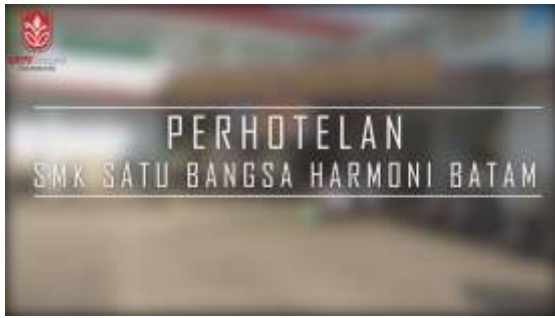
Gambar 7. Judul Video

Pada bagian opening video profil, dimulai dengan logo SMK Satu Bangsa Harmoni Batam dengan background berwarna putih. Setelah itu, muncul bagian judul video yang bertulis “Perhotelan SMK Satu Bangsa Harmoni Batam”.