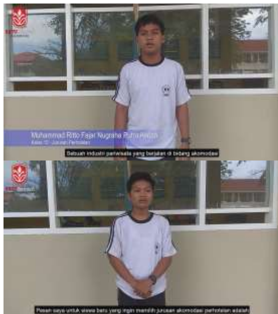
Gamabr 11. Kedua Murid SMK Satu Bangsa Harmoni Batam yang Menjawab Pertanyaan Diajukan Oleh Penulis

Setelah bagian penjelasan, penulis kemudian memperlihatkan bagian penulis menanyakan empat pertanyaan dan dijawab oleh dua murid SMK Satu Bangsa Harmoni Batam.