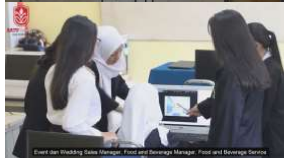
Gambar 9. Klip Pemandangan SMK Satu Bangsa Harmoni Batam

Setelah bagian opening , terdapat penjelasan jurusan perhotelan di SMK Satu Bangsa Harmoni Batam yang dijelaskan oleh Ibu Mislendrawaty. Penjelasan jurusan perhotelan diiringi dengan klip yang memperlihatkan pemandangan dan murid-murid SMK Harmoni Batam.