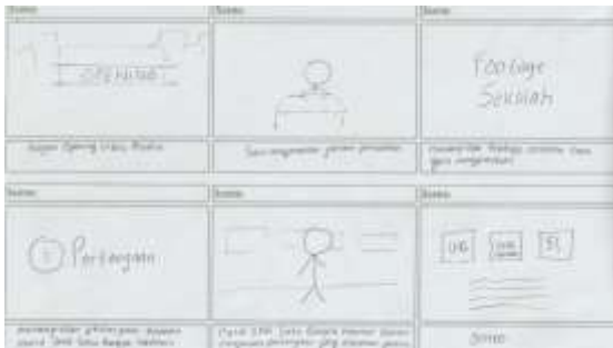
Gambar 1. Storyboard

kebutuhan material atau bahan untuk merancang video (Mustika, 2018). Pada tahap ini, penulis akan merancang video profil sesuai dengan concept yang dibuat oleh penulis. Konsep tersebut akan dibuat dengan aplikasi Adobe Premiere Pro 2020. Adapun storyboard yang dibuat oleh penulis sebagai komposisi dasar yang akan dibuat oleh penulis sebagai berikut: