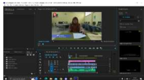
Gambar 5. Tampilan Penulis Melakukan Assembly

Pembuatan merupakan langkah dimana penulis akan merancang video profil. Aplikasi yang digunakan oleh penulis adalah Adobe Premiere Pro 2020.