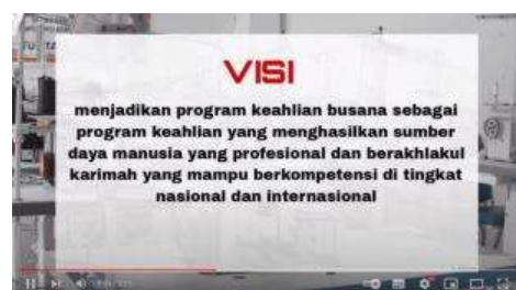
Gambar 8. Visi Jurusan Busana

Pada slide video selanjutnya adalah penjelasan busana oleh siswi busana yang dimana sebelum slide ini muncul ada transisi klip serta tulisan yang muncul dan bergantian secara perlahan.