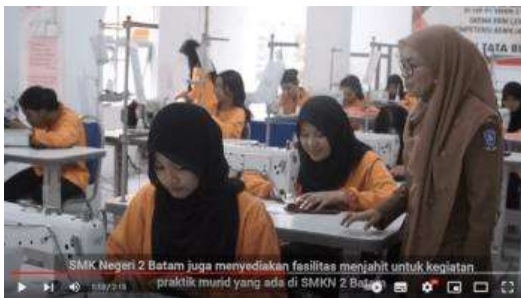
Gambar 11. Kegiatan Praktik Menjahit

Pada tampilan video ini, penulis akan menampilkan beberapa desain busana yang telah dibuat siswi busana sebelum merancang busana. Kemudian, akan dilanjutkan dengan menampilkan kegiatan praktik menjahit yang langsung dibimbing oleh guru busana agar hasil yang dikerjakan lebih optimal.