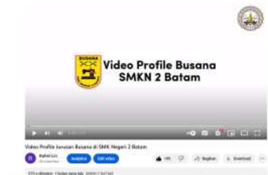
Gambar 18. Dokumentasi Hasil Video Beserta Viewers dan Likers

Video profile jurusan busana di SMK Negeri 2 Batam di- upload oleh penulis di Youtube . Dari video tersebut mendapat 180 viewers dan 360 likers . Selain itu, video tersebut mendapatkan respon positif dari dosen pembimbing, mitra, serta masyarakat umum. Berikut ini adalah link Youtube yang telah di- upload oleh penulis: https://youtu.be/BglEJztNuuk .