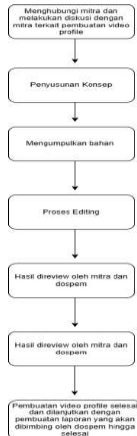
Gambar 1. Storyboard Pelaksanaan Kegiatan

Tahap ini berupa perancangan naskah dan storyboard yang akan diterapkan dalam pembuatan video profil dan kemudian akan diteruskan kepada mitra mengenai kecocokan ide dan masukan terhadap permintaan mitra.