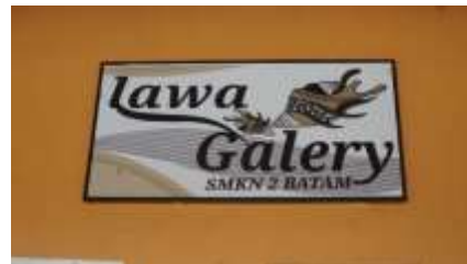
Gambar 6. Lawa Gallery