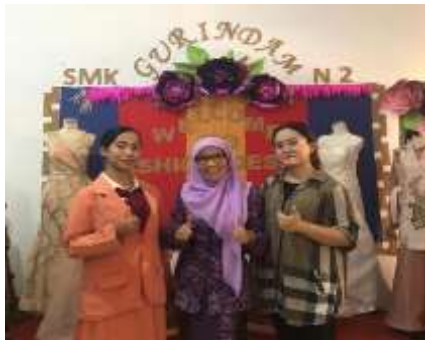
Gambatr 2. Dokumentasi Penyelesaian PkM