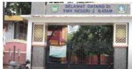
Gambar 7. Sekolah SMK Negeri 2 Batam