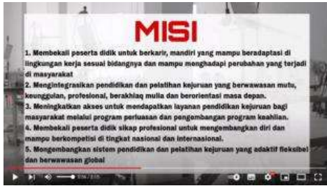
Gambar 9. Misi Jurusan Busana

Pada slide video ini terdapat visi dan misi yang dimana ketika slide visi berganti ke slide misi akan dipadukan dengan transisi, seperti mengganti lembaran halaman buku yang akan dibaca.