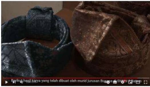
Gambar 16. Hasil Karya yang Disimpan di Lawa Gallery

Pada tampilan video ini berisikan Lawa Gallery yang menjadi tempat penyimpanan hasil karya yang telah dibuat siswi jurusan busana. Kemudian, dilanjutkan dengan tampilan isi dari Lawa Gallery. Transisi yang digunakan adalah gambar yang muncul dan berganti secara perlahan.