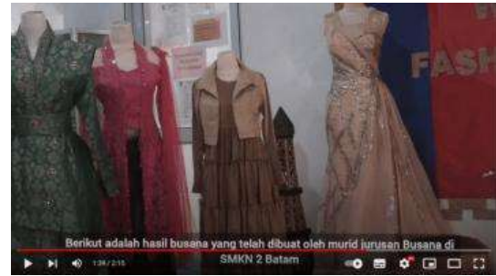
Gambar 12. Hasil Busana

Pada tampilan video ini, penulis akan menampilkan beberapa desain busana yang telah dibuat siswi busana sebelum merancang busana. Kemudian, akan dilanjutkan dengan menampilkan kegiatan praktik menjahit yang langsung dibimbing oleh guru busana agar hasil yang dikerjakan lebih optimal.