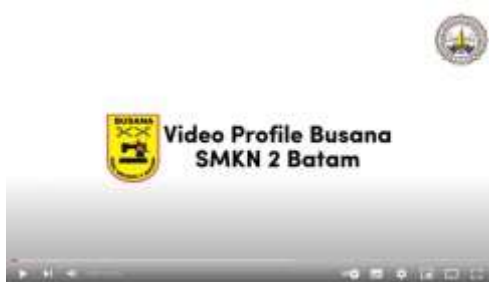
Gambar 5. Bagian Opening Video Profil

Hasil dari kegiatan yang dilakukan adalah pembuatan video profil SMK Negeri 2 Batam jurusan Busana mendapatkan feedback positif dari mitra SMK Negeri 2 Batam dan dosen pembimbing. Berikut beberapa cuplikan video profil yang telah dirancang.