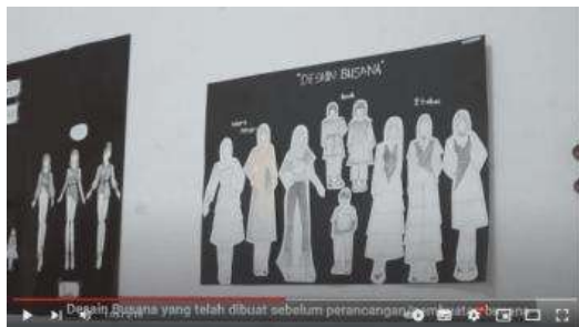
Gambar 10. Desain Busana

Pada slide video ini terdapat visi dan misi yang dimana ketika slide visi berganti ke slide misi akan dipadukan dengan transisi, seperti mengganti lembaran halaman buku yang akan dibaca.