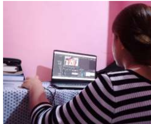
Gambar 4. Proses Editing dan Testing

Tahap ini akan dilakukan penulis untuk menjalankan pembuatan video profil dan memeriksa apakah hasilnya sudah sesuai permintaan mitra.