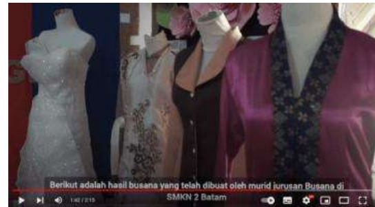
Gambar 13. Hasil Busana

Pada tampilan video tersebut, menampilkan beberapa jenis hasil busana yang telah dirancang oleh siswi busana. Dimulai dari baju melayu, baju kantor, gaun pernikahan, kebaya, dan lain-lain.