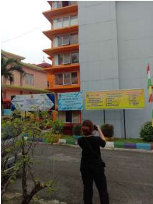
Gambar 2. Proses Pengambilan Video

Tahap ini merupakan pengumpulan bahan dan informasi yang dibutuhkan dalam pembuatan video profil seperti gambar, video, suara, dan lain-lain.