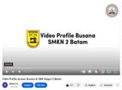
Gambar 1. Dokumentasi Hasil Video