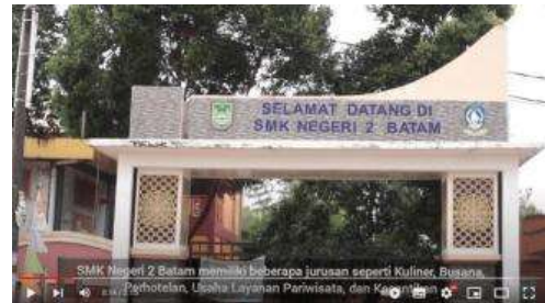
Gambar 6. Penjelasan Singkat Tentang SMK Negeri 2 Batam

Negeri 2 Batam, logo busana, serta tulisan “Video Profile Busana SMKN 2 Batam”. Bagian intro dari video ini memuat transisi yang akan memunculkan logo busana dan tulisan secara perlahan.