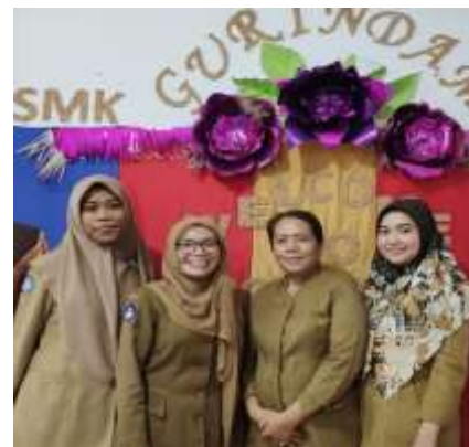
Gambar 8. Guru Jurusan Busana Di SMK Negeri 2 Batam