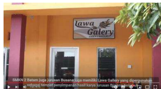
Gambar 14. Lawa Gallery Tempat Penyimpanan Hasil Karya

Pada tampilan video tersebut, menampilkan beberapa jenis hasil busana yang telah dirancang oleh siswi busana. Dimulai dari baju melayu, baju kantor, gaun pernikahan, kebaya, dan lain-lain.