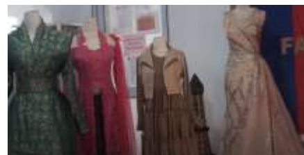
Gambar 9. Hasil Busana