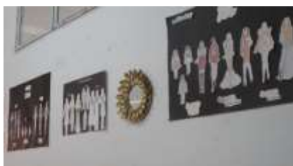
Gambar 4. Desain Busana