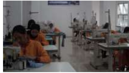
Gambar 5. Kegiatan Praktik Menjahit