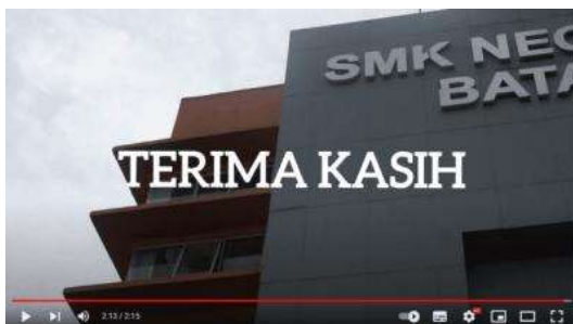
Gambar 17. Bagian Penutup

Pada tampilan video ini berisikan Lawa Gallery yang menjadi tempat penyimpanan hasil karya yang telah dibuat siswi jurusan busana. Kemudian, dilanjutkan dengan tampilan isi dari Lawa Gallery. Transisi yang digunakan adalah gambar yang muncul dan berganti secara perlahan.