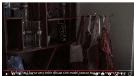
Gambar 15. Hasil Karya yang Disimpan di Lawa Gallery