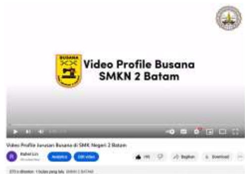
Gambar 18. Dokumentasi Hasil Video Beserta Viewers dan Likers

Video profile jurusan busana di SMK Negeri 2 Batam di- upload oleh penulis di Youtube . Dari video tersebut mendapat 180 viewers dan 360 likers . Selain itu, video tersebut mendapatkan respon positif dari dosen pembimbing, mitra, serta masyarakat umum. Berikut ini adalah link Youtube yang telah di- upload oleh penulis: https://youtu.be/BglEJztNuuk .