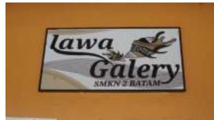
Gambar 6. Lawa Gallery