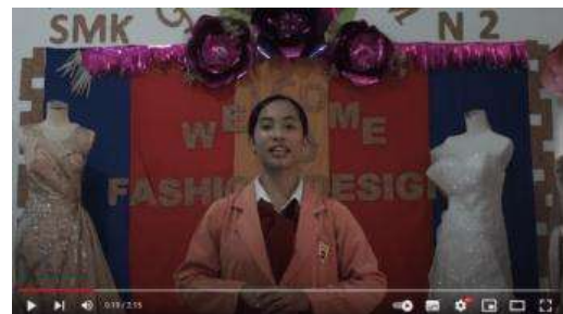
Gambar 7. Penjelasan Busana oleh Siswi Jurusan Busana

Pada bagian kedua setelah opening , akan dijelaskan secara singkat mengenai SMK Negeri 2 Batam yang tulisannya akan dibuat transisi muncul perlahan dan bergantian.