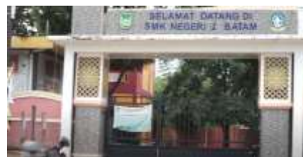
Gambar 7. Sekolah SMK Negeri 2 Batam