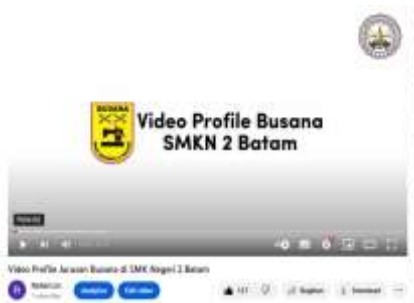
Gambar 1. Dokumentasi Hasil Video