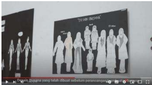
Gambar 10. Desain Busana

Pada slide video ini terdapat visi dan misi yang dimana ketika slide visi berganti ke slide misi akan dipadukan dengan transisi, seperti mengganti lembaran halaman buku yang akan dibaca.