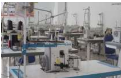
Gambar 3. Ruang Praktik