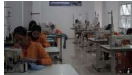
Gambar 5. Kegiatan Praktik Menjahit