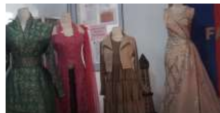
Gambar 9. Hasil Busana