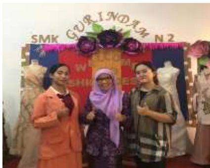
Gambatr 2. Dokumentasi Penyelesaian PkM