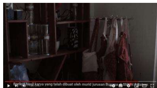
Gambar 15. Hasil Karya yang Disimpan di Lawa Gallery