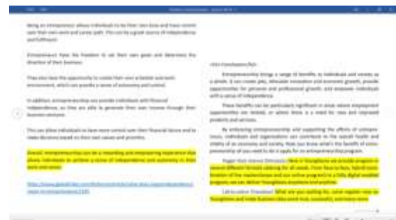
Gambar 25. Contoh Artikel Untuk YoungGems

Ini adalah salah satu contoh artikel dari beberapa artikel yang dibuat berjudul "Benefits of entrepreneurship" dibuat dengan metode QUEST yang akan digunakan saat project YoungGems dimulai. Dalam artikel yang menerapkan metode QUEST (Qualify, Understand, Educate, Stimulate, Transition), pembaca akan disajikan dengan pendekatan yang terstruktur dan efektif untuk menyampaikan informasi. Dengan mengikuti metode QUEST, artikel ini akan memberikan pengalaman membaca yang terstruktur, informatif, dan memotivasi pembaca untuk berpikir lebih dalam atau mengambil langkah selanjutnya terkait dengan topik yang dibahas.