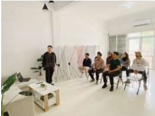
Gambar 26. Proses Presentasi Akhir

yang tepat dan melaksanakannya dengan efektif.