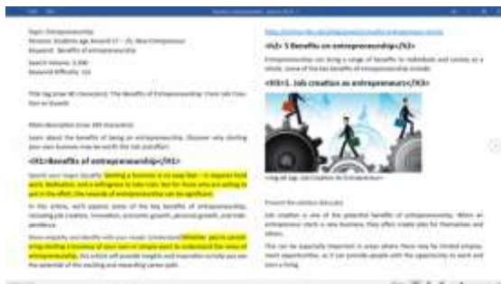
Gambar 21. Contoh Artikel Untuk YoungGems

Keyword positioning adalah peringkat kata kunci pada hasil pencarian mesin pencari. Faktor yang dianalisis mencakup kata kunci, volume pencarian, tingkat kesulitan, URL halaman, dan posisi kata kunci. Memahami keyword positioning membantu menilai kesuksesan halaman web dalam meraih peringkat tinggi untuk kata kunci relevan. Peringkat yang tinggi meningkatkan visibilitas, lalu lintas organik, dan potensi keberhasilan pemasaran online.