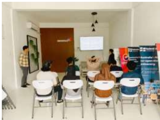
Gambar 27. Proses Presentasi Akhir

Melalui analisis kata kunci, pemahaman terhadap kebutuhan pengguna dapat diimplementasikan melalui konten yang relevan. Dengan penerapan yang tepat, riset kata kunci memiliki potensi untuk mengoptimalkan efektivitas SEO, dan meraih kesuksesan dalam strategi pemasaran online .