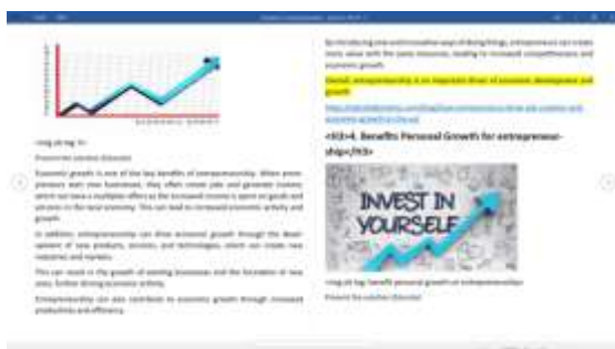
Gambar 23. Contoh Artikel Untuk YoungGems