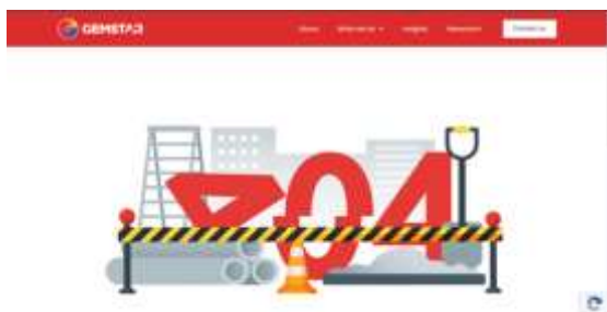
Gambar 13. Contoh Broken Link Untuk YoungGems Website

Broken link atau tautan rusak adalah tautan yang tidak berfungsi atau mengarah ke halaman tidak tersedia. Ini disebabkan perubahan URL, pemindahan, atau