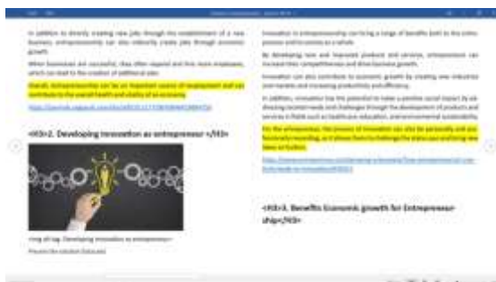
Gambar 22. Contoh Artikel Untuk YoungGems