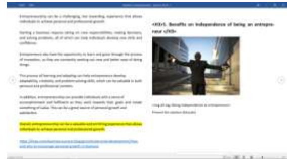
Gambar 24. Contoh Artikel Untuk YoungGems