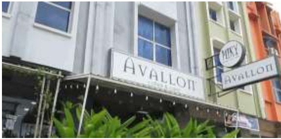
Gambar 4. Gedung Miky Salon dan Avallon Café

Pada tampilan intro , penulis akan menampilkan perjalanan menuju Miky Salon. Selain itu, penulis juga menambahkan tulisan “Miky Salon”, “Avallon Café” dan “Company Profile” sebagai judul permulaan video company profile . Kemudian, penulis akan menampilkan gedung dari Miky Salon dan Avallon Café. Intro akan berjalan dari menit 00:00:00 hingga 00:17:00.