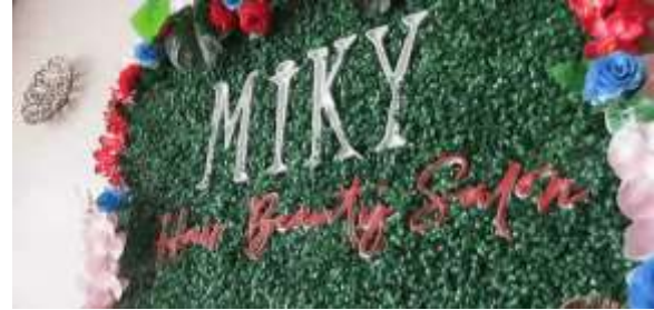
Gambar 6. Desain Interior Miky Salon

Pada tampilan ini, penulis akan menampilkan desain unik disertai penambahan tulisan berupa jadwal operasi dan lokasi salon. Tampilan ini dimulai dari durasi 00:17:01 hingga 01:04:00.