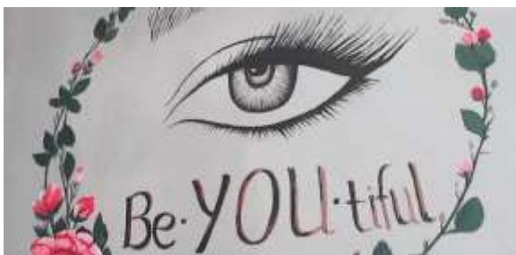
Gambar 5. Lukisan Mural Miky Salon