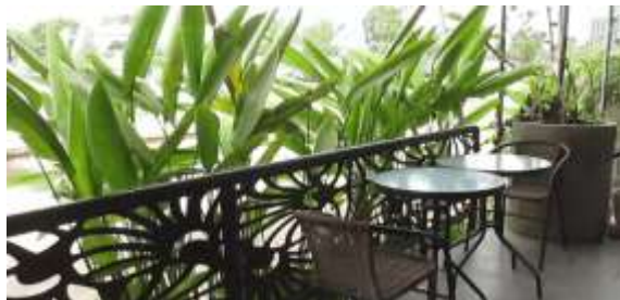
Gambar 10. Eksterior Avallon Café

Pada tampilan ini, penulis akan mulai menunjukkan partner kerja dari Miky Salon yang berupa Avallon Café, dimana 2 perusahaan ini bekerja sama untuk mencapai pelayanan maksimal. Penulis akan menampilkan eksterior dari Avallon Café serta tanaman sekitar. Tampilan ini berjalan dari durasi 01:42:01 hingga 02:06:05.