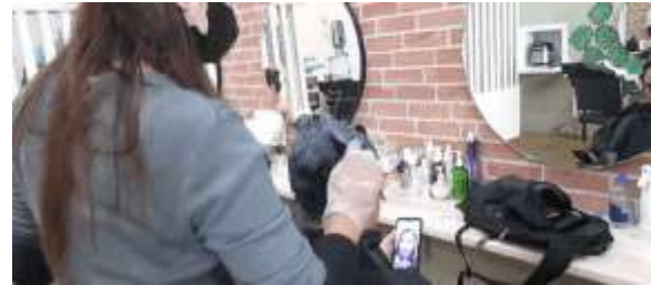
Gambar 7. Pelayanan Miky Salon

Pada tampilan ini, penulis akan menampilkan bagaimana staff Miky Salon memberikan pelayanan terhadap customer . Penulis juga akan menambahkan tulisan berupa jenis pelayanan dan treatment yang disediakan salon. Tampilan ini akan berjalan dari durasi 01:04:01 hingga 01:22:15.