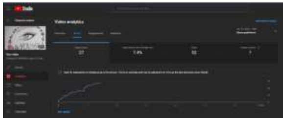
Gambar 15. Analisis Viewer Youtube

Hasil viewers dari video company profile setelah dipublikasi selama 24 jam mencapai view sebesar 52 serta jumlah like yang mencapai 12.