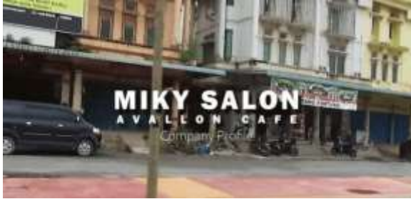
Gambar 3. Judul Video Company Profile