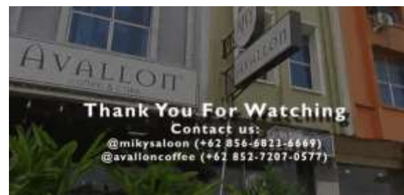
Gambar 13. Outro Video Company Profile

Pada tampilan ini, penulis akan menampilkan kembali gedung dari Miky Salon dan Avallon Café namun disertai dengan tulisan penutup, username Instagram, serta nomor telepon yang dapat dihubungi untuk informasi yang lebih lanjut. Tampilan ini memiliki durasi dari 03:00:11 sampai 03:07:00.