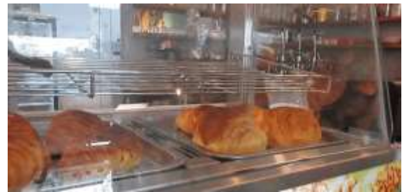
Gambar 12. Makanan Avallon Café

Pada tampilan ini, penulis akan menampilkan makanan serta pencuci mulut yang disediakan oleh Avallon Café. Tampilan ini bermula dari durasi 02:45:16 hingga 03:00:10.