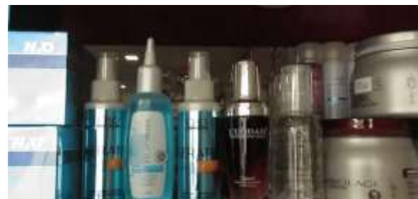
Gambar 8. Produk Miky Salon