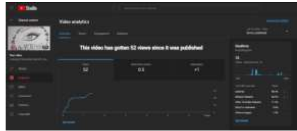
Gambar 16. Analisis Overview Youtube

Pada bagian reach atau pencapaian dalam analisa video company profile yang sudah berhasil dipublikasikan selama 24 jam telah mencapai impressions sebesar 27 dengan 7,4% serta mendapatkan unique views sebesar angka 1.