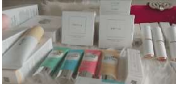
Gambar 9. Produk Miky Salon

Pada tampilan ini, penulis akan menampilkan produk-produk berkualitas yang dipakai oleh Miky Salon serta produk-produk lainnya yang dapat dijual kepada customer . Tampilan ini bermula dari durasi 01:22:15 hingga 01:42:00.