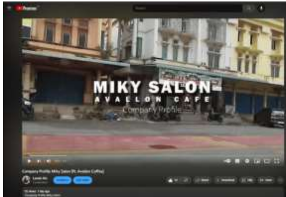
Gambar 14. Hasil Publikasi Youtube

Video company profile Miky Salon telah berhasil dipublikasikan kepada masyarakat, terutama pengguna Youtube. Link dari video telah diberikan penulis kepada pihak pemilik usaha Miky Salon untuk digunakan dengan tujuan yang baik kedepannya.