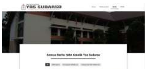
Gambar 4. Tampilan Berita

Halaman Berita ini muncul ketika pengguna website menekan menu Berita. Pada halaman ini akan menampilkan beberapa berita dari SMA Yos Sudarso Batam antara lain seperti aksi sosial, pencapaian akademis, pencaserta Visi dan Misi dari SMA Katolik Yos Sudarso Batam. Halaman Website dapat dilihat pada gambar 4.