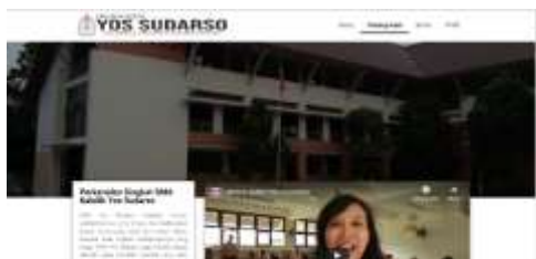
Gambar 3. Tampilan Halaman Tentang Kami

Halaman Tentang Kami ini muncul ketika pengguna website menekan menu Tentang Kami. Pada halaman ini akan menampilkan perkenalan singkat, spritualitas, visi dan misi, fakta dari SMA Katolik Yos Sudarso dan identitas dari SMA Yos Sudarso Batam. Halaman website dapat dilihat pada gambar 3.