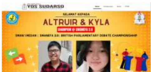
Gambar 2. Tampilan Halaman Home

olimpiade, event terkini dan berita terini. Halaman website dapat dilihat melalui gambar 2.