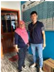
Gambar 2. Dokumentasi Kegiatan Pengerjaan Quizizz “Penggunaan Internet Sehat dan Aman”.