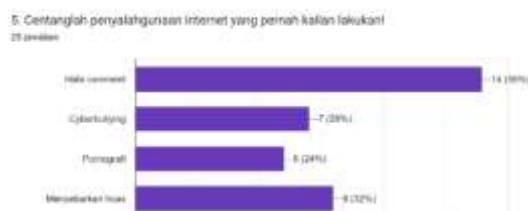
Gambar 4. Hasil Survey Penyalahgunaan Internet

Dapat diketahui bahwa mayoritas pelajar beranggapan bermain secara