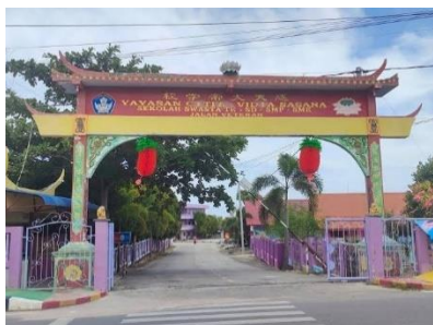
Gambar 1 Gerbang SMKS Vidya Sasana

Gambar 1. diatas merupakan gerbang SMK Vidya Sasana. Tangkapan foto diambil pada tanggal 5 Juli 2021 oleh peneliti. Suasana yang dilihat dari luar gerbang sekolah tampak sepi, dikarenakan masa pandemi ini. Namun, proses pembelajaran di Vidya Sasana tetap lancar melalui sistem daring.