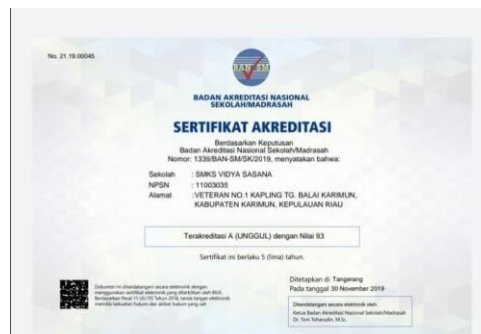
Gambar 4 Sertifikat Akreditasi SMK Vidya Sasana