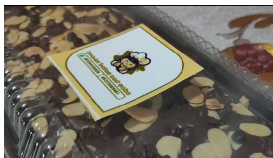
Gambar 1 Kue Brownies Kummi Bolen.

Kami melaksanakan implementasi ini dengan cara mengajak UMKM Kuliner Kummi Bolen untuk bekerja sama mencapai target dan luaran yang telah kami targetkan. UMKM Kuliner Kummi Bolen ini merupakan UMKM yang bergerak di bidang kuliner, UMKM ini hanya berjualan dengan sistem pemesanan pre-order secara online dan tidak memiliki toko secara fisik