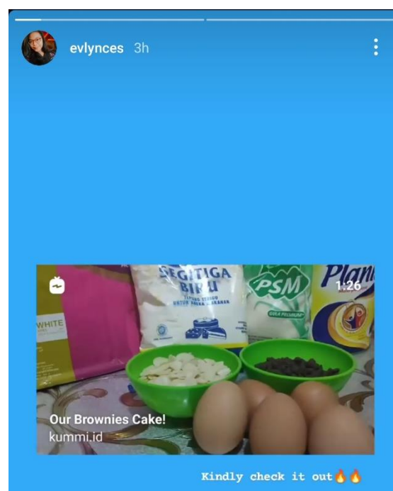
Gambar 3 Salah satu contoh promosi via Instagram Story.

Dalam melaksanakan program ini, kelompok ini memiliki kesulitan dalam melakukannya. Karena dengan adanya PPKM darurat yang dilaksanakan di Provinsi Kepulauan Riau terutama di Kota Tanjung Pinang dan Batam kemudian ditambah lagi dengan tidak semua anggota kelompok kami berasal dari tempat yang sama. Selain itu, kami juga berkendala di waktu, waktu yang kami gunakan untuk melaksanakan program ini hingga selesai sangat singkat sehingga kegiatan yang kami lakukan masih belum maksimal.