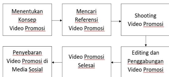
Bagan 1 Proses perancangan pembuatan video promosi salah satu menu Kummi Bolen, sumber : Data diolah (2021)

Proses perancangan luaran dimulai dari penentuan lokasi UMKM di wilayah Kota Tanjungpinang. Pada hari yang telah ditentukan, kami melakukan wawancara untuk memperoleh informasi yang lebih rinci agar dapat mengidentifikasi masalah yang dialami oleh UMKM mitra. Selanjutnya memasuki tahap pelaksanaan implementasi. Perancangan promosi dilakukan dengan pengambilan foto dan video produk-produk. Proses pengeditan video promosi didukung menggunakan aplikasi Adobe Premiere Pro dan juga Wondershare Filmora X. Adobe Premiere Pro dan Wondershare Filmora X merupakan sebuah software editing video yang dikhususkan untuk membuat rangkaian gambar, audio, dan video. Pelaksanaan program PkM dilaksanakan dengan durasi dan waktu kegiatan sebagai berikut.