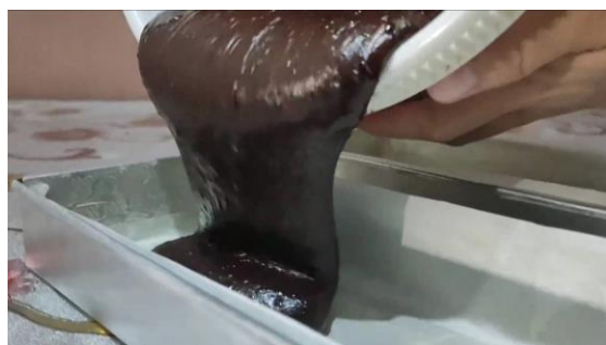
Gambar 4 Salah satu cuplikan dalam video promosi.