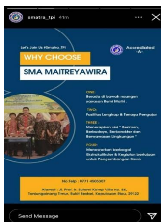
Gambar Gambaran Umum Sekolah