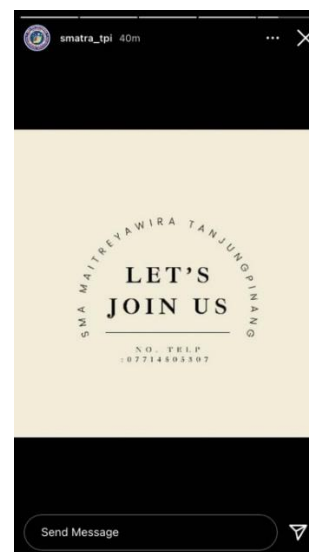
Gambar Promosi Sekolah