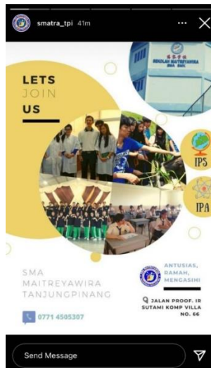
Gambar Promosi Sekolah