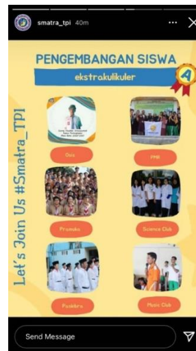
Gambar Pengembangan Siswa