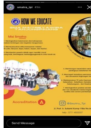
Gambar Visi Misi Sekolah