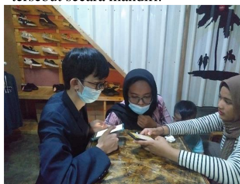
Gambar 5. Dokumentasi Sesi Tanya Jawab