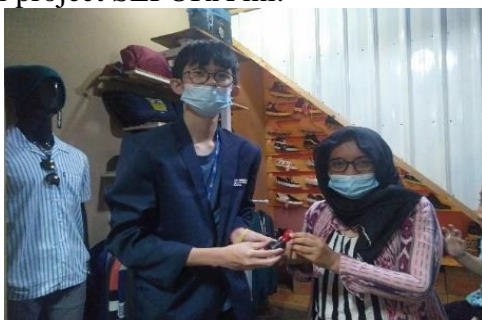
Gambar 6. Pemberian Cap Stempel Kepada Mitra

d) Penutup. Pada akhir kegiatan mitra memberikan ulasan dan tanggapan mengenai pelaksanaan kegiatan dengan mengatakan bahwa kegiatan pelatihan ini sangat bermanfaat dan juga membantu sekali bagi UMKM-nya, karena sebelumnya masih menggunakan pembukuan secara manual serta sering kali menemukan kendala dalam perhitungan pembukuan tersebut, dan juga tidak kepikiran bahwa bisa menggunakan pembukuan melalui aplikasi keuangan digital untuk memudahkan dalam melakukan pembukuan, dan mitra juga mengatakan bahwa kedepannya ia akan menggunakan aplikasi keuangan digital ini untuk melakukan pembukuan sehari-hari mengenai transaksi bisnisnya. Pada akhir kegiatan, kami juga memberikan kepada mitra sebuah cap dengan logo UMKM-nya sebagai sebuah tanda terima kasih dari kelompok kami kepada mitra atas ketersediaannya telah menjadi mitra dari project SEPORA ini.