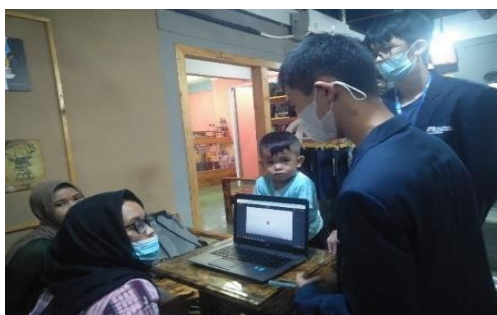
Gambar 3. Dokumentasi Pelaksanaan Sesi Pertama

pelaksanaan kegiatan sesi edukasi ini berupa mitra sudah memahami dan menyadari bahwa saatnya untuk menggunakan aplikasi keuangan secara digital agar dapat memudahkan dalam melakukan pembukuan serta dapat memiliki sebuah sistem pengelolaan keuangan yang efektif bagi UMKM-nya.