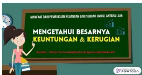
Gambar 1. Hasil Luaran Video

video animasi mengenai edukasi pentingnya pembukuan dan pengelolaan keuangan yang efektif bagi sebuah UMKM, yang bertujuan untuk meningkatkan pengetahuan dan kesadaran terhadap pemilik UMKM mengenai pentingnya untuk memiliki sebuah sistem pembukuan yang efektif. Isi konten yang terdiri dalam video animasi ini berupa penjelasan mengenai pengertian pembukuan, manfaat dari pembukuan terhadap sebuah UMKM, kekurangan atau hambatan dari penggunaan sistem pembukuan secara manual, kelebihan atau manfaat dari penggunaan sistem pembukuan secara digital, serta rekomendasi sebuah aplikasi keuangan digital yang bertujuan untuk memudahkan mitra dalam melakukan pembukuan atau pengelolaan keuangan terhadap UMKM-nya. Kemudian video animasi ini juga dipublikasikan di media massa berupa Youtube , agar dapat diakses dan diketahui oleh masyarakat luas.