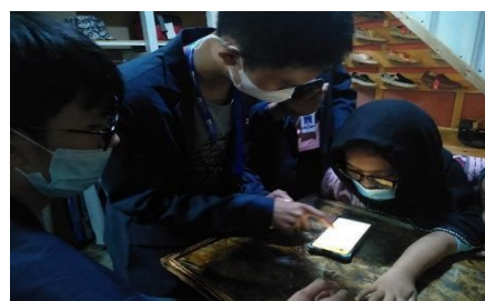
Gambar 4. Dokumentasi Sesi Pelaksanaan Pelatihan Aplikasi Digital

keterampilan mitra dalam penggunaan aplikasi keuangan secara digital, serta adanya dorongan bagi mitra untuk menerapkan aplikasi keuangan digital tersebut dalam pembukuan sehari-hari terhadap UMKM-nya.