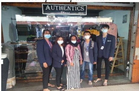
Gambar 7. Foto Bersama Mitra