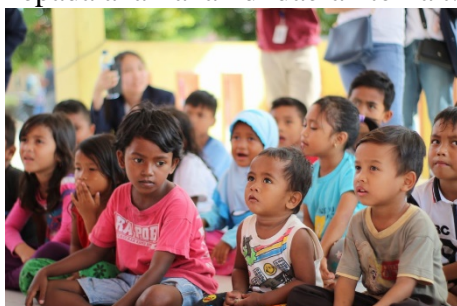
Gambar 1.3 English Literacy

Kegiatan English literacy yang diajarkan kepada anak-anak di daerah terkait.