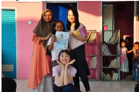
Gambar 1.1 Literature Corner

Anak-anak membantu dalam penyusunan buku-buku serta memisahkan berbagai jenis buku yang ada.