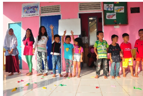
Gambar 1.4 English Literacy

Peserta atau anak-anak yang turut serta dalam program English literacy .