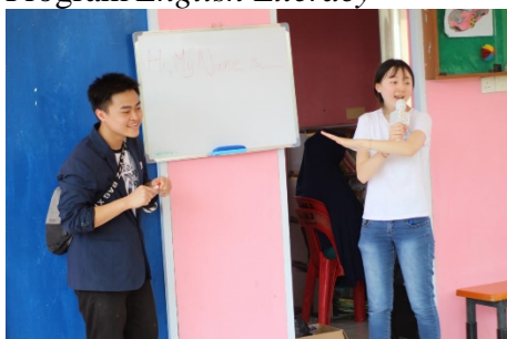
Gambar 1.2 English Literacy

Kegiatan English literacy yang diajarkan kepada anak-anak di daerah terkait.