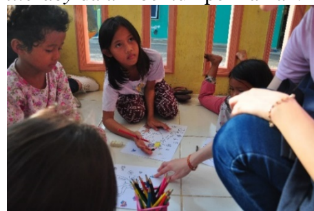
Gambar 1.5 Literature Corner

Partisipasi peserta dalam kegiatan English literacy dalam bentuk permainan.