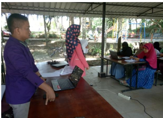
Gambar 3. Penyampaian Materi

Tim pengabdian menyampaikan materi tentang aplikasi kasir pintar, di sini pengabdian memperkenalkan aplikasi kasir pintar, input data barang, input data transaksi, diskon, pajak, laporan transaksi harian, laporan transaksi bulanan dan laporan transaksi tahunan. Aplikasi kasir pintar memberikan kemudahan dalam bertransaksi kepada masyarakat khususnya ibu-ibu PKK Makmur Jaya Tembesi Tower yang memiliki usaha dagang/jualan.