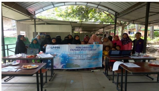
Gambar 6. Foto Bersama

Pengabdian yang dilakukan dengan bertujuan untuk peningkatan pemahaman dan keterampilan masyarakat terhadap aplikasi kasir pintar berbasis android , sehingga dapat diimplementasikan dalam kehidupan sehari-hari dalam usaha dagang mereka serta menunjang kegiatan aktifitas kegiatan mereka, karena aplikasi kasir pintar bisa digunakan dalam jangka panjang dan bisa dilakukan dimana saja.