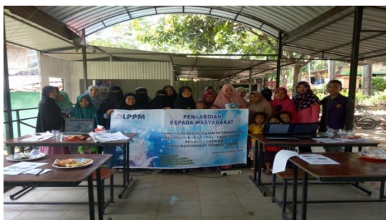
Gambar 6. Foto Bersama

Pengabdian yang dilakukan dengan bertujuan untuk peningkatan pemahaman dan keterampilan masyarakat terhadap aplikasi kasir pintar berbasis android , sehingga dapat diimplementasikan dalam kehidupan sehari-hari dalam usaha dagang mereka serta menunjang kegiatan aktifitas kegiatan mereka, karena aplikasi kasir pintar bisa digunakan dalam jangka panjang dan bisa dilakukan dimana saja.