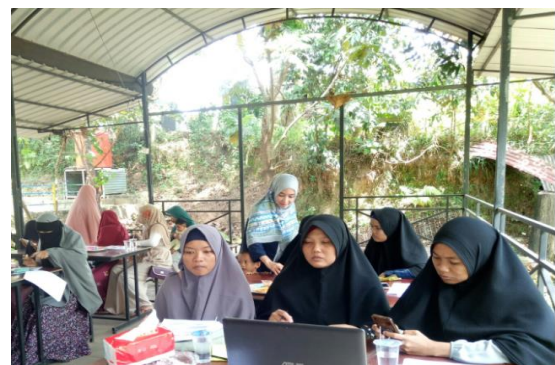
Gambar 5. Implementasi Aplikasi

Selanjutnya menjelaskan bagaimana cara pengoperasian aplikasi kasir pintar seperti input data barang, harga peritem barang, harga jual barang, transaksi, diskon, pajak, laporan transaksi harian, laporan bulanan dan laporan tahunan. Selama pelaksanaan pengabdian para ibu-ibu PKK sangat antusias dan rasa ingin tahu mereka terhadap aplikasi kasir pintar sangat tinggi, karena aplikasi kasir pintar baru pertama kali mereka kenal dan mereka dengar. Materi yang disampaikan oleh tim pengabdian sangat mudah diterima oleh para ibu-ibu PKK Makmur Jaya. Karena banyak para ibu-ibu PKK cepat tanggap terhadap materi yang disampaikan.