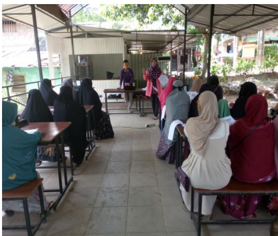
Gambar 4. Penyampaian Materi

Aplikasi kasir pintar sangat membantu dan memberikan manfaat bagi masyarakat seperti seperti input data barang yang bisa dilakukan dengan cara scan barcode , input harga barang