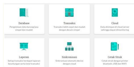
Gambar 1. Fitur Kasir Pintar

Aplikasi kasir pintar sangat mudah diterapkan, jika ingin dicetak dalam bentuk struk, bisa juga dilakukan pada kasir pintar ini dan bisa juga tampilan dalam bentuk gambar.