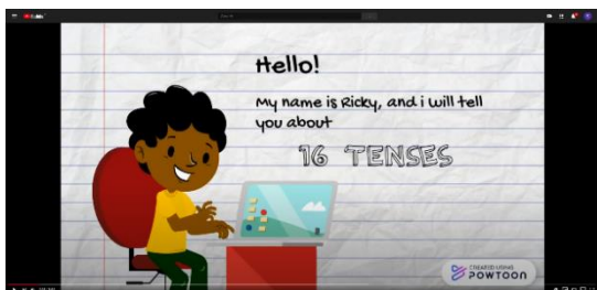
Gambar 4.1 Tampilan Video

sebuah kalimat yang bertanda kalimat positif, kalimat negatif, dan kalimat interogatif; dan juga contoh dari masing-masing pembagian tersebut.