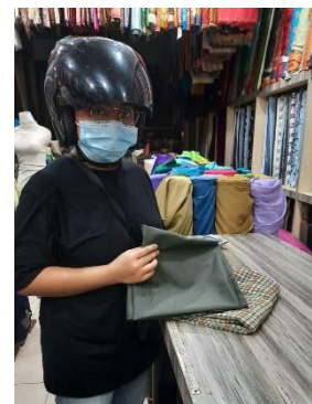
Gambar 1. Dua motif kain yang dipilih sebagai bahan dasar masker