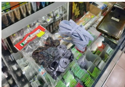
Gambar 3. Karet berukuran sedang dan pengait tali