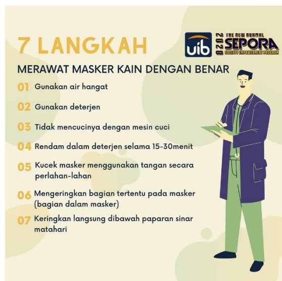
Desain poster 2. Tujuh langkah merawat masker kain dengan benar

wawasan terkait cara penggunaan masker berbahan kain. Tujuannya adalah agar masyarakat dapat memanfaatkan penggunaan masker kain dengan optimal dan memahami cara terbaik untuk menggunakan dan merawat masker berbahan dasar kain. Sosialisasi terkait cara penggunaan dan perawatan masker kain akan kami sampaikan melalui desain poster yang telah kami buat. Ketika masker kami bagikan, kami akan memberikan pemaparan cara perawatan masker produk kami sehingga masyarakat segera mengetahui cara terbaik untuk merawat produk masker kami.