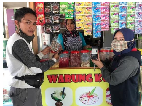
Gambar 8. Pemberian masker pada warga Bengkong.