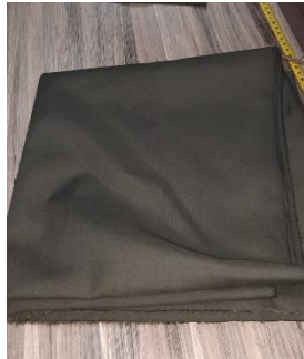
Gambar 2. Detail kain katun polos