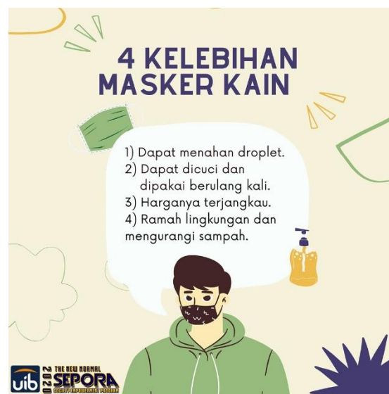
Desain poster 1. Empat kelebihan masker kain

Ketika produk masker kami dibagikan pada masyarakat, kami berencana untuk memberikan sosialisasi terkait cara penggunaan masker berbahan kain. Informasi yang akan kami berikan yaitu anjuran untuk menggunakan masker ketika ingin keluar rumah dan anjuran penggunaan masker kain sebagai salah satu alternatif protokol kesehatan. Hal-hal terkait kelebihan produk masker berbahan kain akan kami sampaikan dengan harapan masyarakat menyadari pentingnya penggunaan masker dan terdorong untuk selalu menggunakan masker ketika ingin keluar rumah.