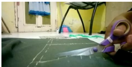
Gambar 5. Proses pemotongan bahan masker

motif dan bahan polos serta bahan tali yang akan digunakan.