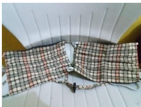
Gambar 7. Sampel produk masker