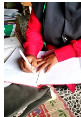
Gambar 5. Proses penggambaran desain masker beserta detail ukuran masker