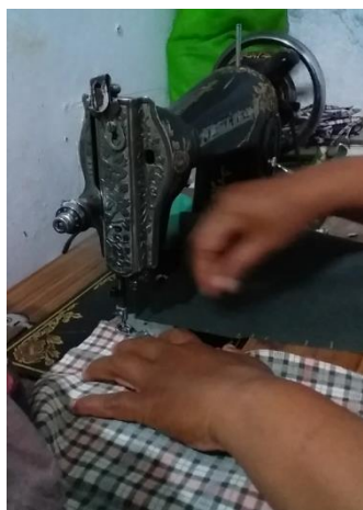
Gambar 6. Proses penjahitan masker