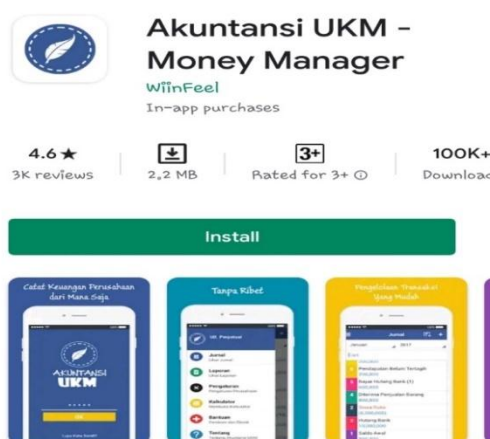
Gambar 1: Akuntansi UKM - Money Manager

Berikut, adalah tampilan dari Akuntansi UKM – Money Manager yang dapat diunduh di google playstore secara gratis, dan gambar disamping ini merupakan contoh dari halaman utama dari aplikasi Akuntansi UKM – Money Manager yang telah diisi dengan pencatatan-pencatatan transaksi pada bulan itu.