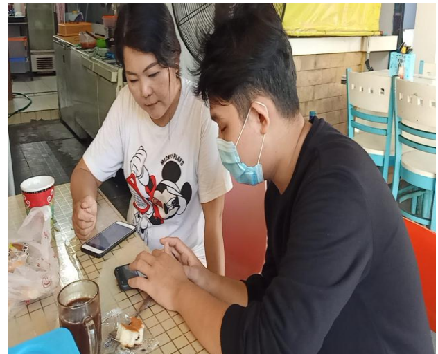
Gambar 4: Neraca Saldo