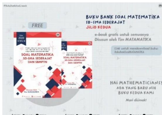
Gambar 5. E-book MATAMATIKA

materi untuk memperkuat pemahaman mengenai matematika, misalnya e-book , atau link internet yang menyajikan informasi yang lengkap, kegiatan webinar dll. Gambar 5. adalah contoh informasi e-book