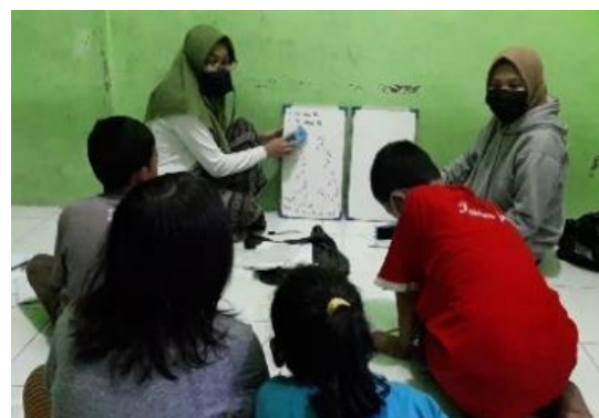
Gambar 2. Bimbingan belajar murid SD di Kelurahan Joglo, Surakarta

Kegiatan dilakukan di salah satu rumah warga. Komunikasi yang baik dengan pemilik rumah, ketua RT dan mahasiswa membuat kegiatan ini berjalan lancar dan disenangi anak-anak karena dilakukan dalam suasana yang santai dan ceria.