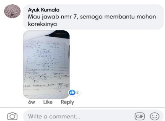
Gambar 4. Contoh pembahasan salah satu soal matematika dari siswa

Hal yang sejenis dilakukan, Ayu Kumala Dewi, mahasiswa Program Studi Matematika, FMIPA UNS. Dia membantu warga siswa SMP dan SMA di RT 02/05 Nayu, Joglo, Surakarta dalam membahas soal-soal pelajaran matematika. Diskusi dilakukan menggunakan media sosial online facebook dan instagram. Gambar 4 adalah contoh jawaban salah satu soal matematika yang didiskusikan.