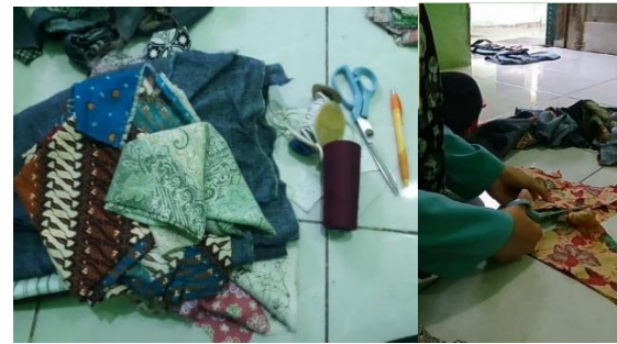
Gambar 8. Kegiatan membuat masker dari sisa potongan kain di Kelurahan Balurwati

Produk lain yang diajarkan ke warga adalah membuat face shield dari bahan styrofoam , mika plastik, lakban dan tali pengikat. Kegiatan ini dilakukan oleh Nurul Aulia, mahasiswa program studi Matematika, FMIPA UNS, yang tinggal di rumah kostnya di RT 03/09 Gulon, Jebres, Surakarta. Dia mengajak ibu-ibu dan anak remaja bersama-sama membuat produk ini.