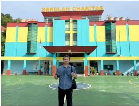
Gambar 1. Observasi langsung di lokasi mitra