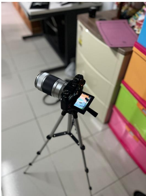
Gambar 2. Perangkat Produksi

Dalam proses produksi, digunakan perangkat multimedia seperti kamera mirrorless , tripod, dan mikrofon eksternal