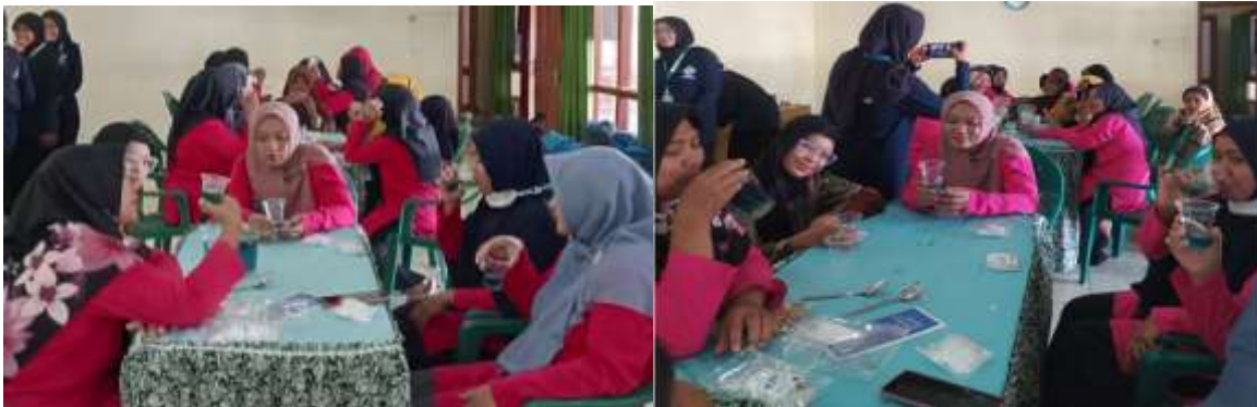
Gambar 5. Peserta Menikmati Teh Telang

Selanjutnya, pada sesi akhir kegiatan pelatihan pembuatan produk produk teh telang ini, peserta diberikan angket evaluasi ketercapaian program. Melalui kegiatan tersebut, didapatkan hasil analisis yang ditunjukkan oleh Gambar 6. Hasil analisis angket menyatakan bahwa sebanyak peserta dengan tingkat pemahaman sangat baik sejumlah 50%, baik 45%, cukup baik 5% dan kurang baik 0%. Secara umum hasil pemahaman menunjukkan bahwa peserta memahami cara pembuatan produk teh telang. Peserta memahami bagaimana langkah-langkah pembuatan produk teh telang, cara pengemasan, dan bagaimana cara pemasaran produk teh telang.