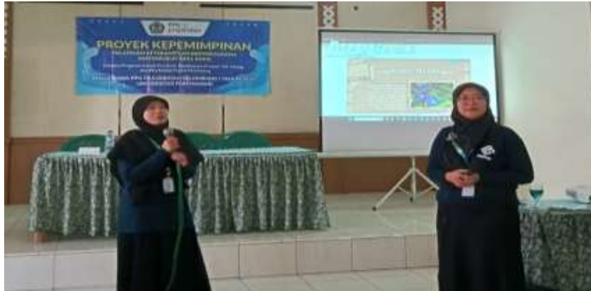
Gambar 3. Penyampaian Materi Tentang Teh Telang

tetapi kurang memahami bagaimana cara pengolahan teh telang. Sedangkan sebagian besar peserta lainnya belum pernah mendengar mengenai bunga telang, meskipun pernah melihat tanaman tersebut. Adapun kegiatan penyampaian materi produk teh telang dapat dilihat pada Gambar 3.