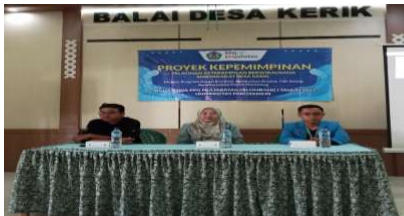
Gambar 2. Pembukaan Kegiatan Pelatihan Pembuatan Teh Telang

Pelatihan pembuatan produk teh telang kepada ibu-ibu PKK Desa Kerik dilaksanakan pada bulan Agustus 2024 dengan beberapa kali pertemuan. Tim menyiapkan kegiatan pelatihan dimulai sejak bulan Juni 2024, dua bulan sebelum pelaksanaan. Sebelumnya, tim melakukan observasi dan wawancara terhadap perangkat desa Kerik dan ibu-ibu PKK terkait kondisi di lapangan dan pelatihan keterampilan yang dibutuhkan bagi masyarakat desa Kerik secara garis besar. Berdasarkan hasil observasi dan wawancara, kami menyimpulkan bahwa adanya kebutuhan untuk meningkatkan keterampilan berwirausaha bagi masyarakat desa Kerik, khususnya ibu-ibu PKK, sebagai upaya peningkatan kondisi ekonomi keluarga. Kegiatan pelatihan dibuka secara formal oleh anggota tim dari Universitas Negeri PGRI Madiun dan sambutan dari pihak perangkat Desa Kerik sebagaimana Gambar 2.