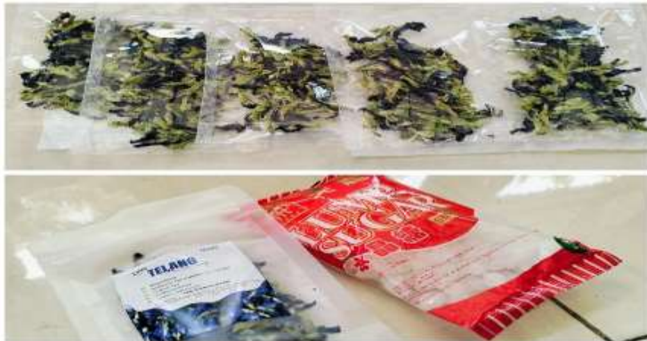
Gambar 1. Bahan Pembuatan Produk Teh Telang

Proses pembuatan produk teh Telang melalui beberapa tahapan sebagai berikut 1) siapkan satu kantong teh yang masih kosong. 2) Isi dengan 5 bunga telang yang sudah dikeringkan, 1 sendok makan gula batu, dan 3 potong sereh. 3) Siapkan 1 gelas (200 ml) air panas (disarankan yang baru mendidih). 4) Masukkan 1 kantong teh telang yang sudah dibuat sebelumnya. 5) Mengaduk secara perlahan. 6) Mendinginkan 5 - 10 menit hingga teh telang berubah warna menjadi biru keunguan. 7) Teh telang siap untuk disajikan.