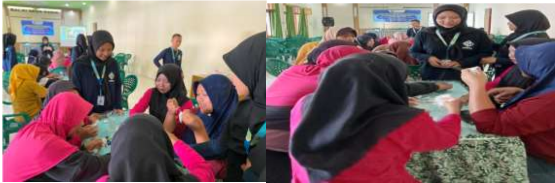
Gambar 4. Praktik Pembuatan Produk Teh Telang

beberapa kelompok untuk mendemonstrasikan langsung proses pembuatan produk teh Telang dan berikut pengemasannya. Anggota tim akan berkeliling mendampingi peserta dalam membuat produk teh Telang, cara pengemasannya dan bagaimana menyeduh teh Telang yang sudah dibuat. Tim juga menyediakan teh Telang yang sudah dibuat sebelumnya sebagai tester bagi peserta. Adapun kegiatan sebagaimana Gambar 4.