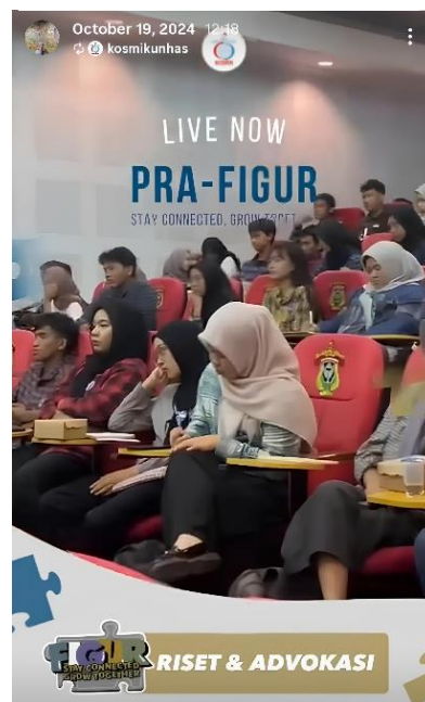
Gambar 8. Audiens Materi Riset 2

Diskusi juga menunjukkan bahwa ruang interaktif lebih efektif dibandingkan penyampaian satu arah dalam membantu peserta menghubungkan teori dengan kebutuhan aktual mereka. Dalam konteks pengajaran tinggi, engagement yang dibangun melalui dialog terbukti berkorelasi dengan pemahaman yang lebih mendalam dan pendekatan belajar yang lebih reflektif. Mattanah et al. (2024) menegaskan bahwa keterlibatan peserta dalam kelas sangat dipengaruhi oleh kualitas hubungan akademik yang terbangun. Di sisi lain, Nind and Katramadou (2023) menjelaskan, pengajaran metode riset yang baik menuntut strategi dalam memberi kesempatan pada mahasiswa untuk bertanya, menilai, dan menafsirkan kembali materi.