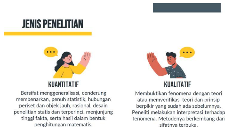
Gambar 4. Materi Jenis Penelitian dalam Ilmu Komunikasi

Penyusunan materi pun diarahkan agar selaras dengan dunia pengalaman mahasiswa komunikasi, terutama dalam membaca gejala media, perilaku audiens, dan isu sosial yang hadir di ruang digital. Penekanan ini bukan sekadar pertimbangan teknis, melainkan strategi pedagogis agar riset sosial dipahami sebagai perangkat berpikir yang dekat dengan kehidupan akademik mereka. Sebagaimana ditekankan dalam bagian pendahuluan, active learning pada kelas metode riset terbukti membantu mahasiswa memahami konsep kuantitatif maupun kualitatif secara lebih kokoh. Sementara di sisi lain, hasil riset mengenai faculty-student rapport menunjukkan bahwa kualitas relasi pengajar–mahasiswa berkaitan dengan engagement dan deep learning yang lebih baik (Jeram, 2024; Mattanah et al., 2024).