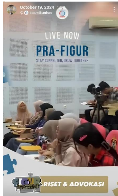
Gambar 7. Audiens Materi Riset 1

Diskusi juga menunjukkan bahwa ruang interaktif lebih efektif dibandingkan penyampaian satu arah dalam membantu peserta menghubungkan teori dengan kebutuhan aktual mereka. Dalam konteks pengajaran tinggi, engagement yang dibangun melalui dialog terbukti berkorelasi dengan pemahaman yang lebih mendalam dan pendekatan belajar yang lebih reflektif. Mattanah et al. (2024) menegaskan bahwa keterlibatan peserta dalam kelas sangat dipengaruhi oleh kualitas hubungan akademik yang terbangun. Di sisi lain, Nind and Katramadou (2023) menjelaskan, pengajaran metode riset yang baik menuntut strategi dalam memberi kesempatan pada mahasiswa untuk bertanya, menilai, dan menafsirkan kembali materi.