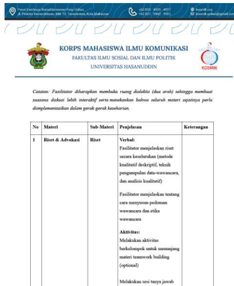
Gambar 2. Term of Reference Pra-Forum Inisiasi Gerakan Unik dan Radikal (Pra-FIGUR) 2024