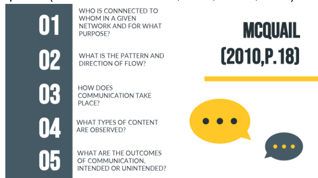
Gambar 3. Materi Analisis Riset dalam Ilmu Komunikasi

Tahap pra-kegiatan menjadi fase paling menentukan karena pada titik inilah arah pengabdian dibentuk sejak awal. Pada kegiatan ini, pihak panitia mengirimkan ToR untuk materi riset yang terdiri dari sub materi dan penjelasan. Setelah menerima ToR, materi PowerPoint lalu disusun dengan prinsip kesederhanaan struktural, keterbacaan yang tinggi, dan alur logis yang mudah diikuti oleh mahasiswa baru. Melalui konteks pengajaran riset sosial, pendekatan seperti ini penting karena literatur menunjukkan bahwa pembelajaran metodologi akan lebih efektif apabila dirancang secara bertahap, tidak terlalu padat istilah, dan memberi ruang bagi peserta untuk membangun pemahaman dari konsep dasar ke aplikasi (Nind and Katramadou, 2023; Jeram, 2024).