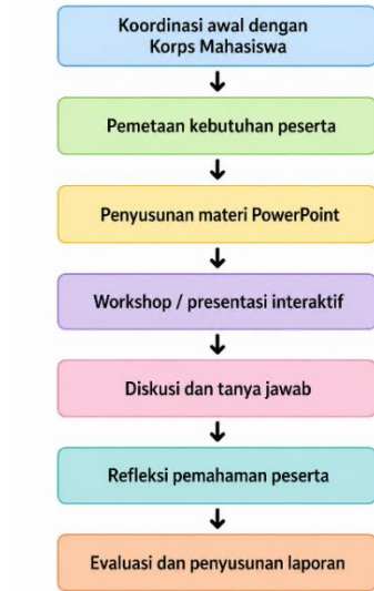
Gambar 1. Diagram Pelaksanaan Pengabdian

Rangka kerja pelaksanaan dapat digambarkan sebagai berikut.