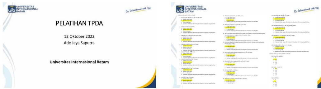
Gambar 3. Materi pelatihan Pelatihan TPDA

Kegiatan ini dilaksanakan selama dua hari yaitu pada 12 – 13 Oktober 2022 pukul 14.00 – 16.00 WIB. Narasumber (pembicara) pada kegiatan pengabdian kepada masyarakat ini adalah Ade Jaya Saputra, S.T., M.Eng. selaku dosen Teknik Sipil Universitas Internasional Batam (UIB).