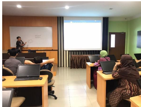
Gambar 1. Pelatihan TPDA hari pertama

Kegiatan yang telah dilaksanakan pada pengabdian kepada masyarakat adalah dengan memberikan “Pelatihan Tes TPDA (Tes Potensi Dasar Akademik bagi dosen di Universitas Internasional Batam dengan metode Ceramah dan Diskusi. Kegiatan ini dilakukan dengan menggunakan hybrid yaitu secara online zoom meeting dan offline di kampus. Berikut adalah beberapa dokumentasi kegiatan pelatihan yang diikuti oleh dosen di lingkungan Universitas Internasional Batam.