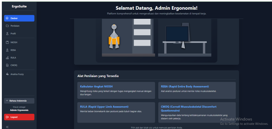
Gambar 2. Dashboard aplikasi

Untuk percobaan aplikasi dapat dilakukan pada link berikut https://ergonomic-assessment-suite.netlify.app/ dengan tampilan awal dashboard rancangan aplikasi adalah sebagai berikut: