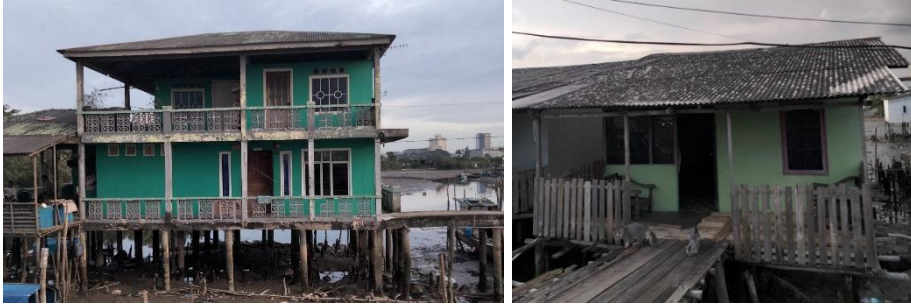
Gambar 2. Rumah Beton Bertingkat (Kiri) dan Rumah Kayu (Kanan) di Kampung Tua Tanjung Uma

Penelitian (Santri, 2018) di Desa Kalibuntu menunjukkan fenomena serupa: rumah tradisional nelayan yang direnovasi dengan gaya modern mengalami hilangnya nilai-nilai estetika lokal. Dengan demikian, transformasi di Kampung Tua Tanjung Uma dapat dipahami sebagai proses homogenisasi visual, di mana arsitektur lokal kehilangan kekhasannya karena dominasi gaya perkotaan. Temuan ini memperlihatkan bahwa urbanisasi membawa perubahan visual yang cukup signifikan terhadap identitas arsitektur kawasan pesisir.