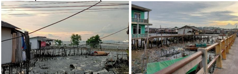
Gambar 4. Penampakan Saat Air Laut Surut yang Memperlihatkan Sampah di Sekitar Tiang-tiang Rumah

(Pinassang et al., 2021) juga mencatat bahwa Kampung Tua Tanjung Uma menghadapi permasalahan lingkungan seperti akumulasi limbah domestik dan menurunnya vegetasi mangrove. Temuan ini sejalan dengan hasil observasi penelitian ini, di mana area di bawah rumah panggung kini banyak tertutup sampah plastik dan limbah rumah tangga. Vegetasi mangrove yang dulunya melindungi kawasan dari abrasi kini berkurang hingga 70%, digantikan oleh struktur buatan. Akibatnya, estetika kawasan menurun, dan ekosistem pesisir kehilangan fungsinya sebagai pelindung alami dari abrasi. Berkurangnya vegetasi mangrove juga menyebabkan kawasan menjadi lebih rentan terhadap kerusakan lingkungan akibat gelombang laut dan perubahan iklim pesisir.