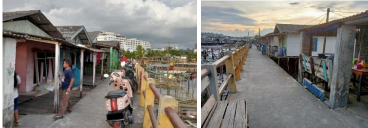
Gambar 3. Rumah-rumah pada Pelantaran yang terbuat dari Gabungan Beton dan Kayu/ Triplek

Dengan demikian, perubahan visual di Kampung Tua tidak sekadar perubahan bentuk, tetapi juga representasi hilangnya makna simbolik arsitektur pesisir sebagai ekspresi budaya. Rumah panggung yang dulunya menjadi simbol adaptasi terhadap lingkungan kini beralih fungsi menjadi bentuk hunian pragmatis tanpa konteks budaya. Oleh karena itu, diperlukan pendekatan yang lebih holistik untuk mengintegrasikan elemen tradisional dalam pembangunan modern sehingga identitas budaya lokal tetap terjaga. Upaya ini mencakup penyusunan kebijakan perlindungan yang lebih tegas dan pelibatan masyarakat lokal dalam proses perencanaan. Selain itu, pelestarian visual kawasan juga dapat dilakukan melalui pengembangan pedoman desain kawasan yang mempertahankan karakter arsitektur pesisir sebagai identitas Kampung Tua.