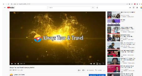
Gambar 3. Video Company Profile yang telah diupload di Youtube

Setelah melakukan implementasi pada Always Tour and Travel ada beberapa hal yang menjadikan Always Tour and Travel menjadi lebih baik dengan adanya video company profile yang dipublish ke internet sehingga meningkatkan brand awareness customer yang dapat meningkatkan omset penjualan Always Tour and Travel