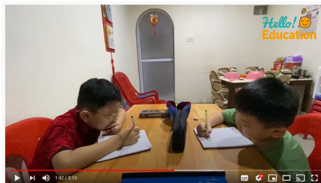
Video Company Profile Hello Education