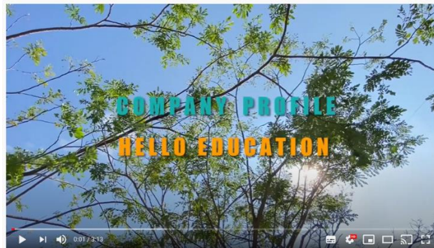
Video Company Profile Hello Education