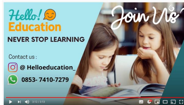
Gambar 5. Ending video company profile Hello Education

Setelah melakukan implementasi pada Hello Education ada beberapa yang menjadikan perusahaan Hello Education menjadi lebih baik :