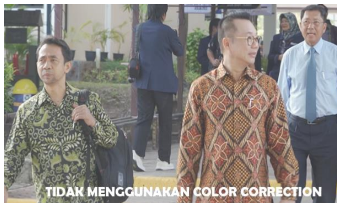
Gambar 4. Video Tanpa Color Correction

Penulis juga menambahkan color correction pada video yang sudah diedit untuk memperbaiki dan memperbagus warna pada video, contoh penggunaan color correction dapat dilihat pada gambar 4 dan 5.