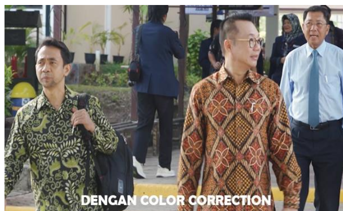
Gambar 5. Video Dengan Color Correction

Gambar 6 merupakan akhir dari video, penulis menambahkan logo Universitas Internasional Batam. Setelah pengeditan video selesai, penulis melakukan export pada video sehingga hasil video dapat dikirimkan