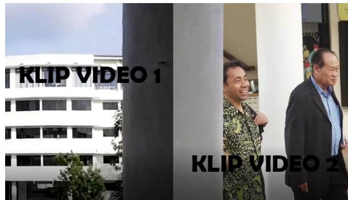
Gambar 3. Transisi Video Menggunakan Teknik Masking

muncul secara gradual dan berakhir dengan menghilang secara perlahan, slide adalah transisi klip satu ke klip lainnya dengan cara menyelip secara horizontal maupun vertikal .