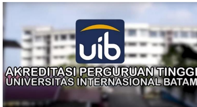
Gambar 2. Intro Video Akreditasi Perguruan Tinggi Universitas Internasional Batam

Video diedit menggunakan software Adobe Premiere Pro CC 2020 . Gambar 2 merupakan intro dan judul dari video, penulis menambahkan logo Universitas Internasional Batam berserta teks judul di depan klip video gedung universitas.