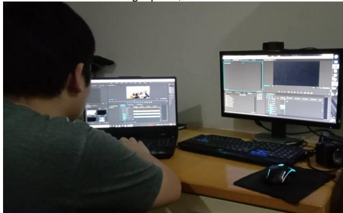
Gambar 1. Proses Editing Video Akreditasi Perguruan Tinggi Universitas Internasional Batam

Hasil yang dihasilkan dari penelitian ini adalah video berkualitas 1080p yang berisi tentang kegiatan akreditasi perguruan tinggi Universitas Internasional Batam, hasil akan diberikan pada pihak Universitas Internasional Batam dengan harapan dapat meningkatkan citra dan nama baik universitas di masyarakat luar. Proyek dimulai dengan perekaman seluruh kegiatan akreditasi oleh tim videographer , kemudian seluruh file di kirim ke penulis untuk diedit.