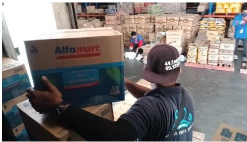
Gambar 3. Rancangan B2B marketing dengan alfamart

b. Implementasi kedua adalah menggunakan business to business marketing yang dilakukan di minimarket alfamart