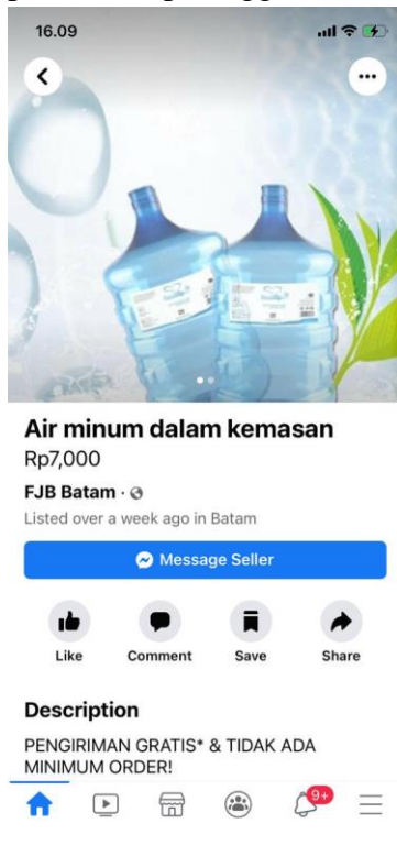
Gambar 4. Rancangan promo di sosial media

c. Implementasi ketiga adalah pembuatan harga promo perpaket yang telah di tetapkan dengan perusahaan untuk menarik pembelian pelanggan