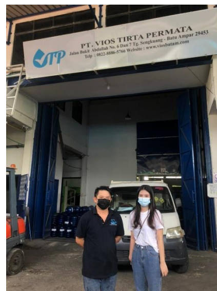
Gambar 6. Foto bersama pemilik di lokasi kerja praktek