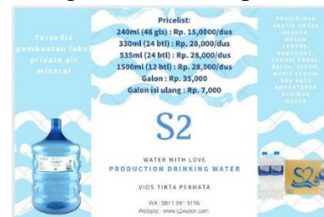
Gambar 1. Rancangan brosur social media