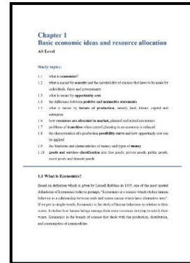
Gambar 4.2 Antarmuka bab pada e-module , sumber: Peneliti (2021).

tugas dan tes mandiri, untuk pegangan guru juga memiliki lampiran kunci jawaban, kriteria penilaian, serta umpan balik atau formulir penilaian.