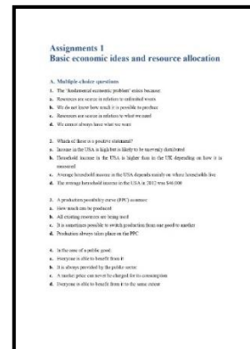
Gambar 4.3 Lembar latihan pada e-module

Lembaran yang disusun dalam e-module pembelajaran terdiri dari 3 jenis, yaitu soal-soal tugas berupa pilihan ganda, kuis essay yang didesain secara unik dan menarik.