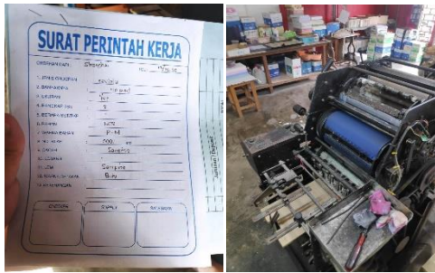
Gambar 4.3 Salah Satu Contoh Penerapan Mitigasi Risiko di CV. Comformindo.

untuk mencegah maupun mengatasi risiko yang ada.