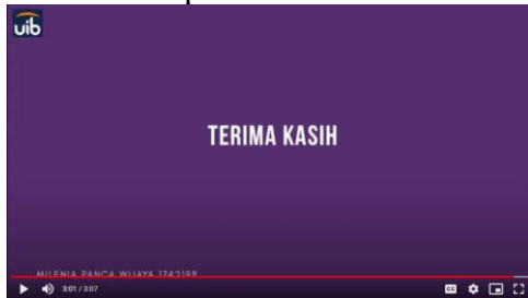
Gambar 6 Tampilan akhir video