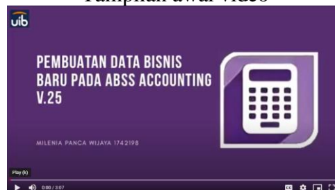
Gambar 4 Tampilan awal video