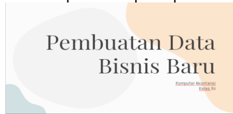
Gambar 1 Tampilan awal powerpoint

Pembuatan luaran bahan ajar digital ini berlangsung dari bulan Oktober 2020 sampai dengan Februari 2021 dengan waktu kurang lebih 4 bulan. Lokasi pelaksanaan implementasi bahan ajar di SMK Kartini Batam yang berada di lokasi Jl. Ir. Sutami, Patam, Sekupang Kota Batam.