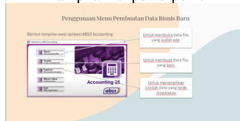
Gambar 2 Tampilan isi powerpoint