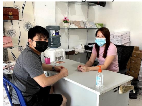
Gambar 19. Wawancara Dengan Penyelia