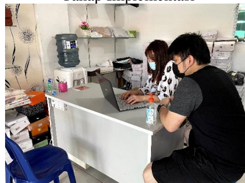
Gambar 20. Tahap Implementasi