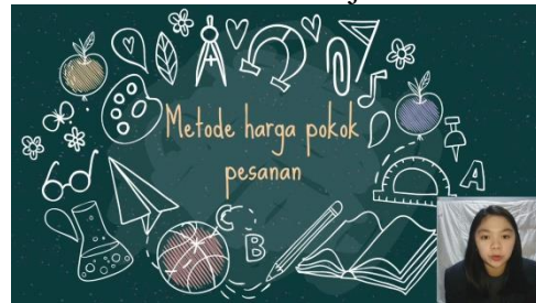
Gambar 1.2 Video Pembelajaran