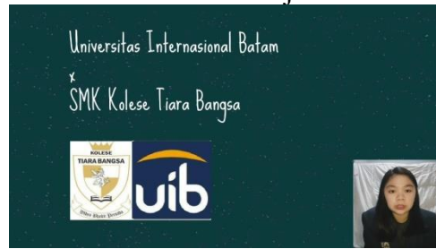
Gambar 1.1 Video Pembelajaran